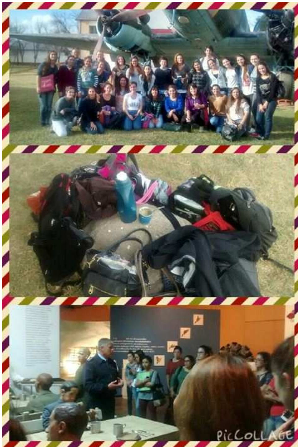
Figura 2: Fotografías tomadas durante el recorrido en el Museo Tecnológico Aeroespacial.

Los estudiantes recorrían los espacios, hacían comentarios y preguntas, sacaban fotos, mostraban interés y entusiasmo por los objetos y relatos que forman parte de nuestra historia individual y