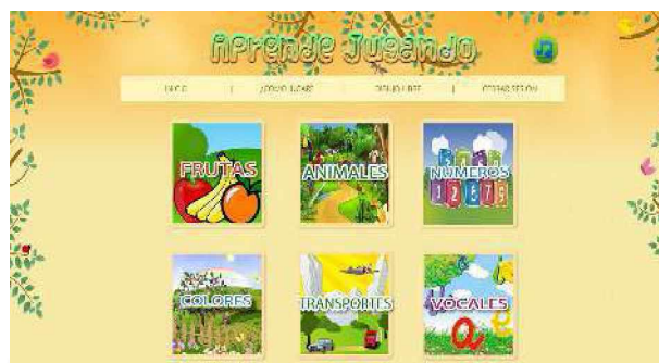
Figura 1. Menú principal.

de los juegos, el niño podrá volver al menú principal, a través de un botón distintivo.