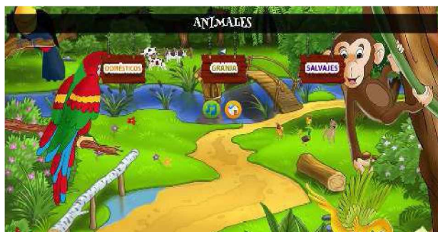
Figura 3. Introducción a la sección Animales.

El juego de animales se compondrá en tres categorías (Figura 3): en domésticos, granja y salvajes. Cuando pase el mouse sobre cada botón, se reproducirá un audio indicándole sobre que se trata.