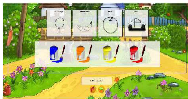
Figura 9. Identificación de los Colores en el nivel Fácil

Se deben colorear las figuras incompletas (Figura 9) que se encuentran según esté establecido. Para conocer de qué color tiene que pintar cada figura, el alumno deberá pasar con el mouse por encima de cada uno de los baldes de colores y escuchar la consigna. Podrá equivocarse las veces que sea necesario pero alentando al niño a volver a intentar con el objetivo de estimular el proceso cognitivo.