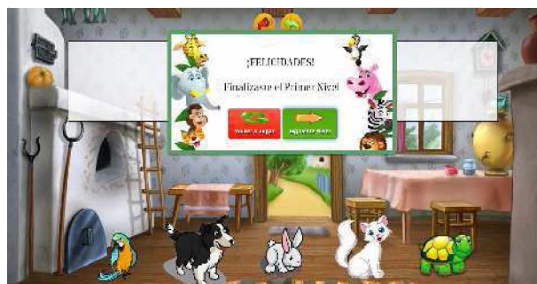
Figura 6. Finalización del nivel en el juego Animales

Puede intentarlo las veces que sea necesario, alentando al niño a volver sobre esa instancia. Una vez que haya contestado de forma correcta el total de las figuras, según la categoría que esté en actividad, finalizará el nivel y se desplegará un cuadro el cual permitirá pasar al siguiente nivel (Figura 6) o volver a jugar, registrando los resultados en la base de datos una vez que haya finalizado el juego para su posterior evaluación.