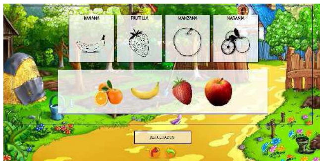
Figura 2. Sección Frutas, nivel Fácil

de la fruta que corresponda. Podrá equivocarse las veces que sea necesario pero alentando al niño a volver a intentar.