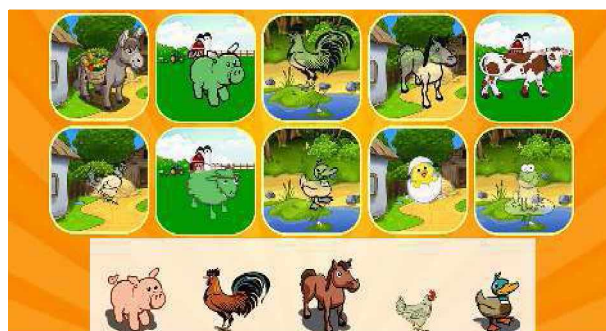
Figura 5. Sección Animales en el nivel Granja.

Con respecto a los animales de la granja y salvajes (Figura 5), cada una de las figuras se encontrará dentro de un recuadro representando con imagen de fondo su hábitat natural con el objetivo de que el niño identifique y clasifique según corresponda.