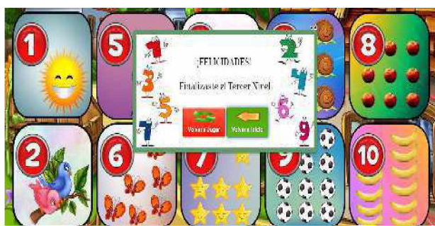
Figura 8. Finalización del nivel en el juego Números.

Una vez colocados los números en el casillero correspondiente, finalizará el nivel y se desplegará un cuadro (Figura 8) el cual permitirá pasar al siguiente nivel o volver a jugar.