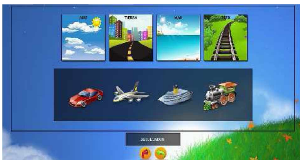
Figura 10. Identificación de los Transportes en el nivel Fácil