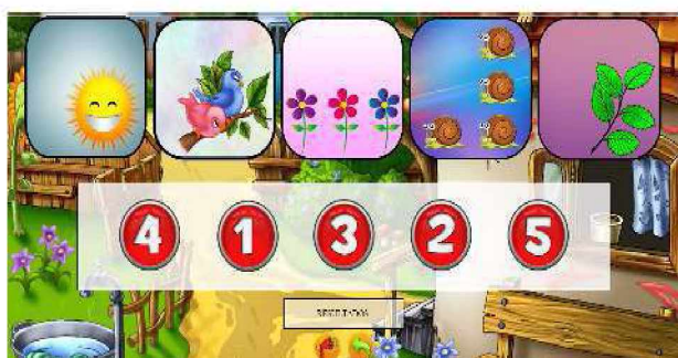
Figura 7. Identificación de Números en el nivel 1 a 5.

Esta sección consiste en la división de tres niveles: los números del 1 al 5, del 6 al 10 y los 10 números completos, será el docente quien decidirá qué nivel jugará cada niño para luego realizar la evaluación. Se dispondrán de una serie de imágenes con una cantidad dada de figuras y además, se situarán los distintos números que representa a cada una de ellas (Figura 7). El alumno deberá escuchar el audio al pasar el mouse sobre cada número para ayudarlo a contar y poder arrastrar el número hasta la cantidad de figuras que logra identificar.