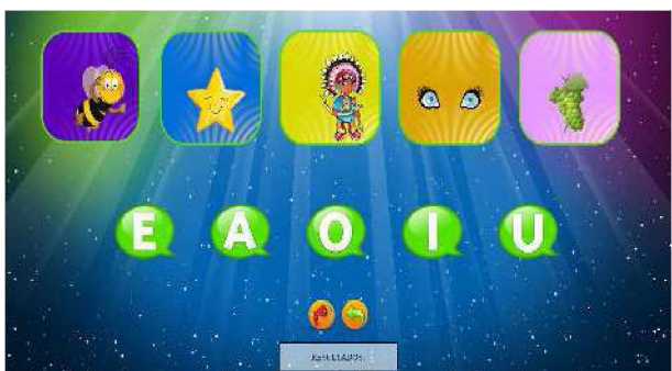
Figura 11. Identificación de las Vocales en el nivel Fácil

En un escenario, se dispondrán las distintas imágenes con una figura dada la cual la primera letra que identifica a la misma, es una vocal y, por otra parte, se encontrarán las vocales que representan a cada una de esas imágenes (Figura 11). El alumno deberá pasar con el mouse sobre cada imagen de vocal para escuchar a que figura se refiere y arrastrarlo hasta el cuadro correspondiente.