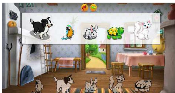
Figura 4. Sección Animales en el nivel Doméstico.

Se deberá arrastrar la figura de cada animal hasta su contorno, seleccionando y asociando los mismos de manera arbitraria y sin ninguna imposición de tiempo (Figura 4).