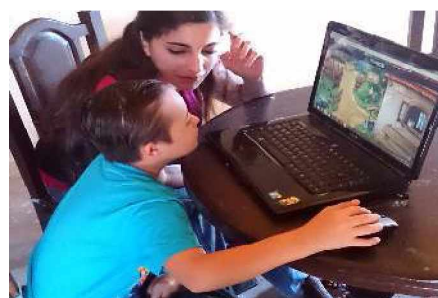
Figura 12. Prueba de Campo

clasificación por domésticos, granja y salvajes, fue la sección que el alumno presentó el mayor número de respuestas erróneas y donde pregunto más veces cuales eran los animales, aunque se mostraba muy contento por escuchar los sonidos reales de los mismos.