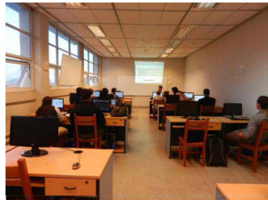
Taller práctico de programación de Accesibilidad Web