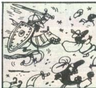
Viñeta 4 1

Curiosamente, aquí todos los encuadres carecen de fondo; sin embargo, este artificio no juega en detrimento de la expresión artística, sino que potencia sus posibilidades de sentido: del mismo modo en que la ausencia de ropa en las esculturas griegas dan al hecho plástico una connotación de eternidad, así Oski enmarca en el blanco total a la figura de un héroe sin tiempo.