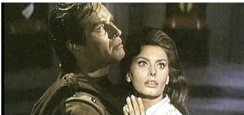
Fotograma de EL CID : primer plano de Charlton Heston y Sofía Loren como Rodrigo y su enamorada 4

Con estas figuras de atracción y prestigio internacionales (quizás sea por ello que sólo los papeles secundarios y las labores técnicas fueron para los artistas españoles) el director y su productor trabajaron para concretar el sueño de crear lejos de Hollywood una nueva plaza para la filmación de “películas colosales” porque los costos eran bajos y la ganancia podría ser millonaria.