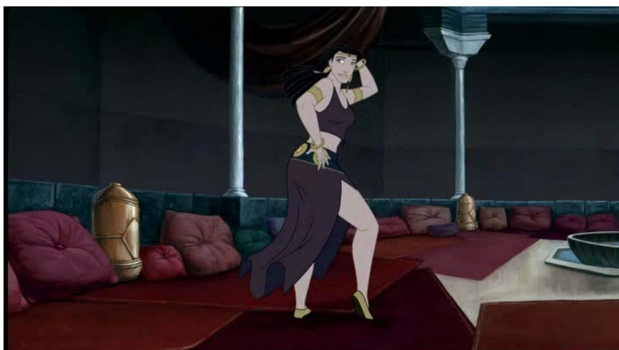
Fotograma de EL CID, LA LEYENDA: Gimena baila ante Yusuf 2

No obstante, son varias las escenas en las que la conducta de Jimena se parangona con la que podría ser la de una heroína posmoderna. Tal el fragmento donde es perseguida por Ordóñez, pero ambos son capturados por Al Kadir y llevados como prisioneros ante Ben Yusuf. En este punto de la diégesis fílmica acontece otra escena en la que se pone de manifiesto la astucia de nuestra protagonista. Luego de la danza de las odaliscas, Jimena (vestida como esclava) queda a solas con Yusuf y trata de librarse de él: se levanta y baila sensualmente, al punto de acercarse al gran jefe, le extiende un vaso de vino y lo hace beber para propinarle un severo golpe en la cabeza con una jarra, que lo deja desvanecido.