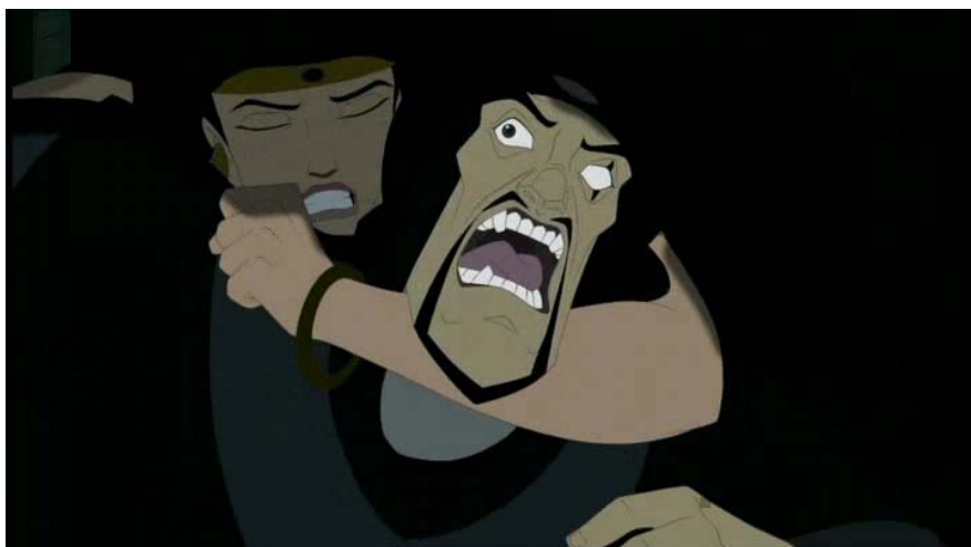
Fotograma de EL CID, LA LEYENDA: Gimena logra su objetivo y pelea con Yusuf.