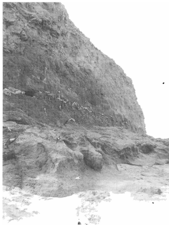
Sector de acantilados costeros en el partido de General Pueyrredón, provincia de Buenos Aires. Las "escorias" y "tierras cocidas" se distribuyen fundamentalmente en el tercio inferior.

En cuanto a las escorias, el estudio petrográfico revelaba que sus características microscópicas no coincidían con las de ningún tipo de lava volcánica conocida. Estaban formadas por una matriz vítrea y fragmentos de varios minerales, como cuarzo, plagioclasa, piroxeno y magnetita. La matriz vítrea