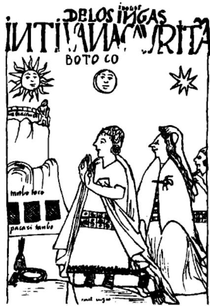
Dibujo de ídolos incas de la crónica de Felipe Guamán Poma de Ayala, 1615. "De los ídolos Ingas/Inti, Uana, Cauri, Tanbo Toco/Uana Cauri/Tambo Toco/Pacari tanbo/en el Cuzco".

Luego de varias horas de súplicas constantes, entre abundante alcohol y coca, el espíritu se manifiesta a través del curandero cuando éste provoca una serie de ruidos extraños, gemidos y gritos. Por