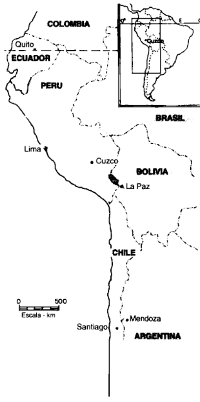
Territorio del "mundo andino".

La religión tiene un papel primordial en todos los actos y momentos de la vida. Todo cuanto