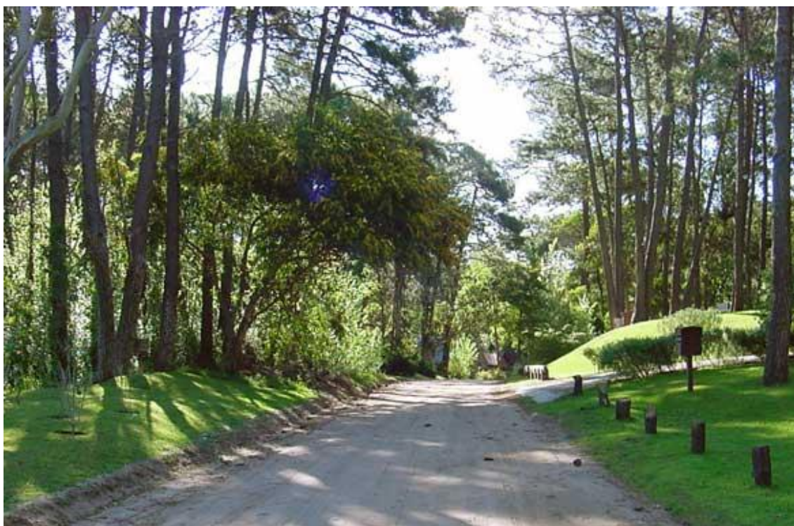
Localidad de Cariló

Sin embargo, con anterioridad, ya se había establecido el primer Paisaje Protegido. En efecto, por Ley 12.099 (B.O. 05/05/98) se declaró como tal a la localidad de Cariló, Partido de Pinamar, con el fin de proteger su paisaje. Este fue, entonces, el primer antecedente de protección de un ambiente natural asociado a valores socio-culturales y turísticos, que resultaban relevantes para la comunidad de Cariló que venía bregando por la protección del bosque que tanto caracteriza a esa localidad.