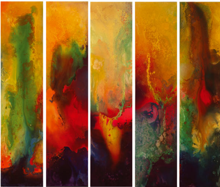
“Dánae”, Alfredo Prior, 2010, Museo de Arte Latinoamericano de Buenos Aires -MALBA