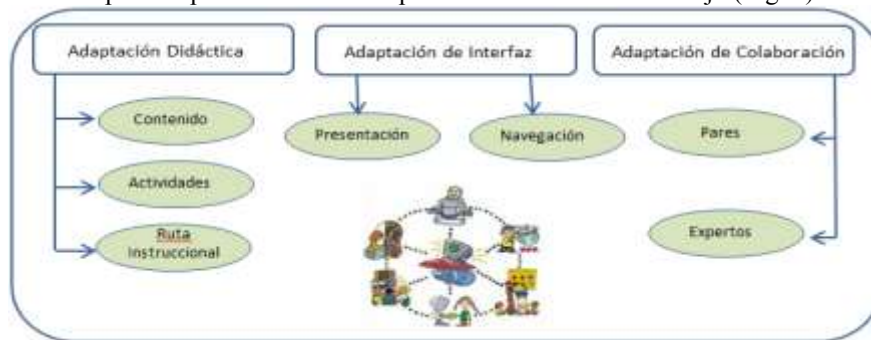
Figura 1: Tipos de adaptación

A partir de considerar diferentes aproximaciones teóricas [2, 3, 6, 9] respecto a los tipos de adaptación o personalización en e-learning, hemos determinado los siguientes tipos de adaptación para el contexto de personalización de este trabajo (Fig. 1).