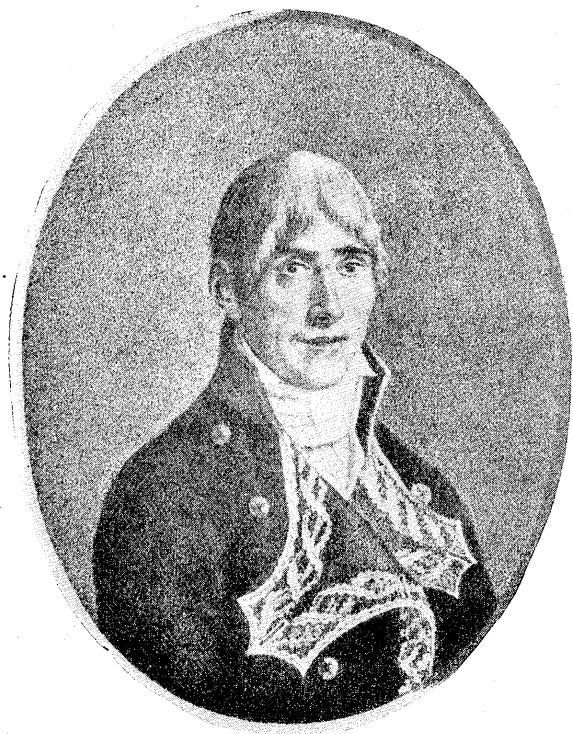
Don Félix de Azara

Nació en Barbunales el 18 de Mayo de 1746