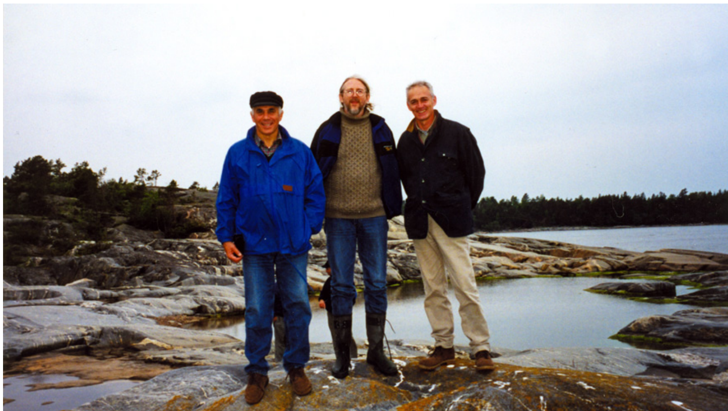
Simpnas, Suecia, 1999