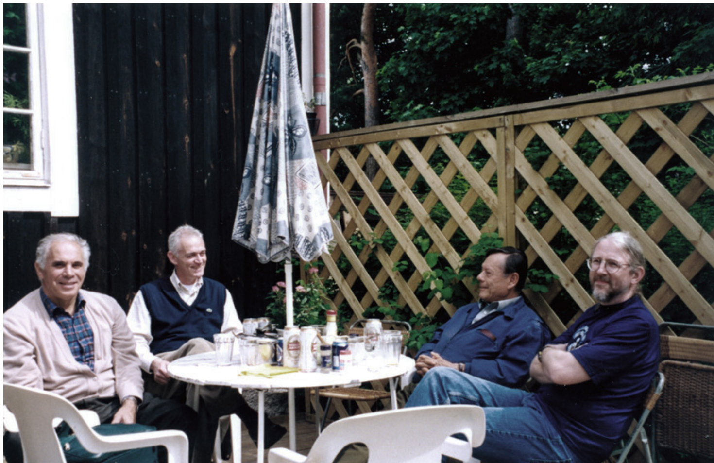
Estocolmo, Suecia, 1999