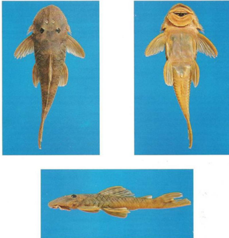
Fig. 1. - Lithoxancistrus orinoco n. gen., n. sp., holotype de vues dorsale, ventrale et latérale. Lithoxancistrus orinoco n. gen., n. sp., holotype in dorsal, ventral and lateral view.

par Isaac J.H. ISBRÜCKER *, H. NIJSSEN * et Plutarco CALA **