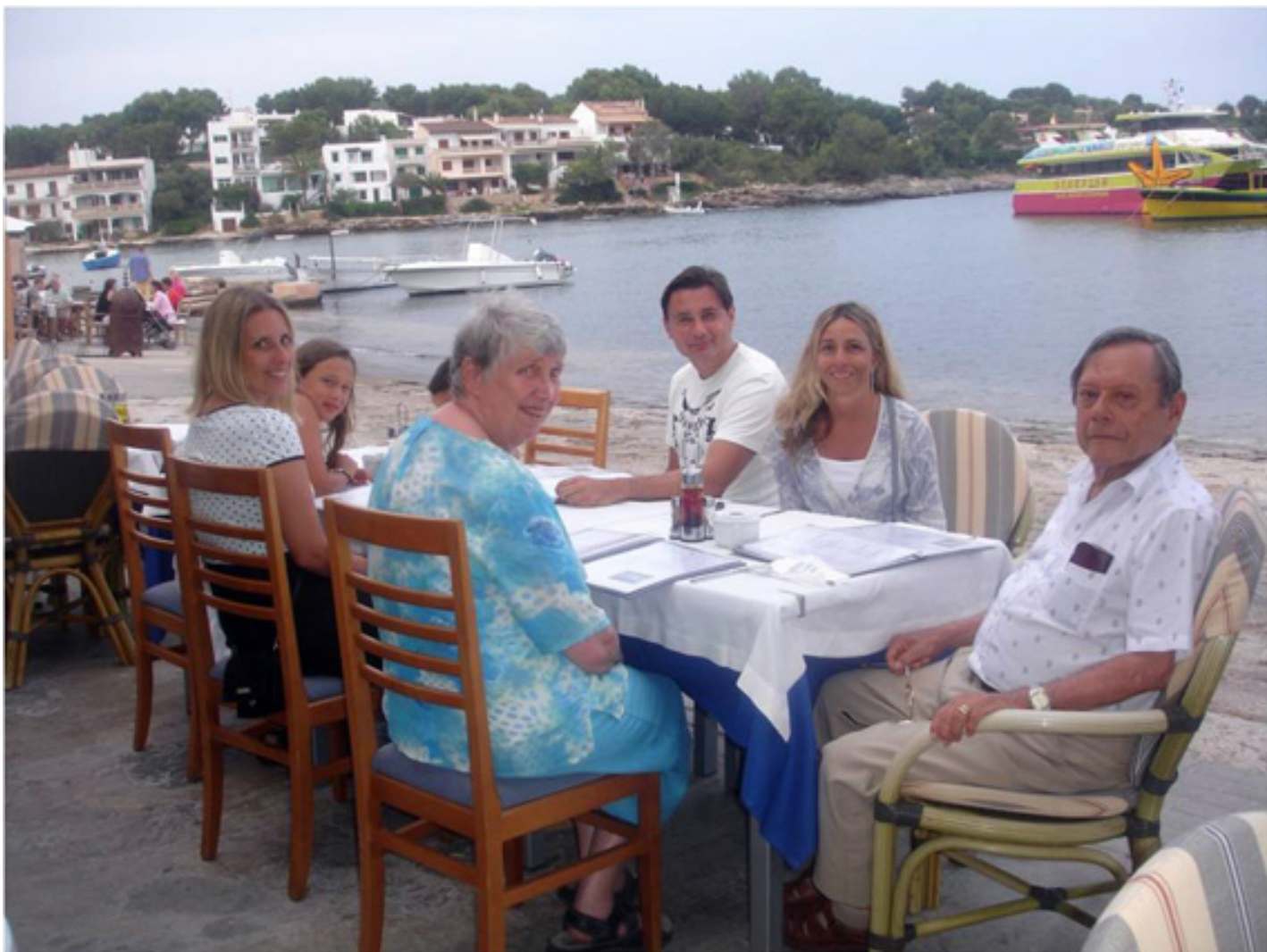
Familia de Vacaciones en Mallorca, España