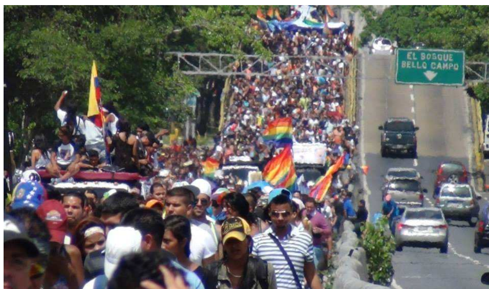
Figura 2: Marcha del Orgullo LGBTI del 30 de junio de 2014 en Avenida Libertador, Caracas.

Un momento histórico en materia de derechos LGBTI en Venezuela fue el 31 de enero de 2014, cuando se realizó la entrega del Proyecto de Ley de Matrimonio Civil Igualitario (1), que tiene el