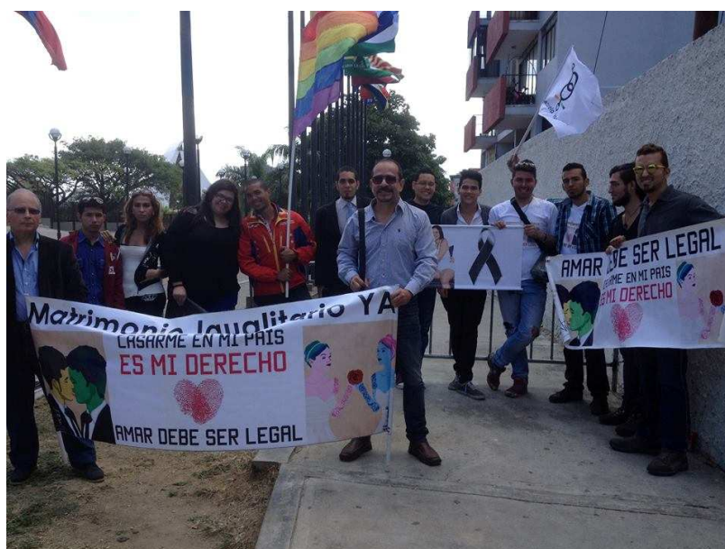
Figura 4: Entrega del Recurso de Nulidad ante el Tribunal Supremo de Justicia, el día 29 de enero de 2015.

Ahora bien, el activismo LGBTI en Venezuela puede comprenderse desde un tejido audiovisual, especialmente si se revisan los documentos audiovisuales sexodiversos producidos desde 1982. Pero ¿a qué llamamos películas sexodiversas?, ¿a qué llamamos documentales sexodiversos?