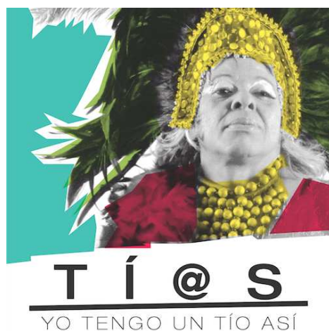
Figura 12: Afiche de Tí@s (2015).

Hay un conjunto de cortometrajes documentales realizados por estudiantes de la Escuela de Medios Audiovisuales (EMA) de la Universidad de los Andes (ULA) que presentan las orientaciones sexuales y las identidades y expresiones de género de la manera más creativa. Ellos son: Adjetivo , de Labarca (2010); Almuerzo con extraños , de Rodríguez (2010); Mesa para seis , de Corona (2012); Construcción , de Pérez Barreto (2012); El reto más difícil es ser una Barbie , de Lacruz (2012). Otros cortos se han realizado de modo independiente pero con un tono activista bastante claro. Es el caso de Expropiación artística , de Bravo (2008); Una al margen , de Castro y Castrillo (2011); Clase Magistral , de Pérez (2012); El transexual nace o se hace , de Bogarín y otros (2012); y En revolución la diversidad es natural , de Ramos y otros (2012), producido por Vive TV. Todos estos trabajos han sido exhibidos en el Festival Venezolano de Cine de la Diversidad-FESTDIVQ y algunos de ellos en festivales de cine LGBTI fuera del país.