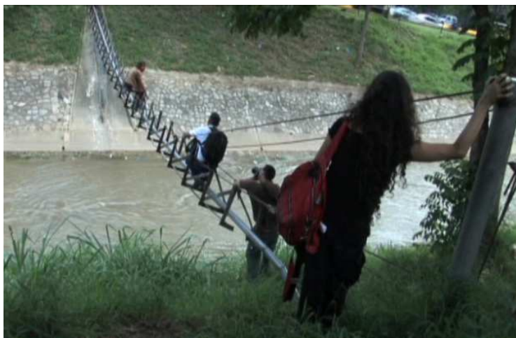
Figura 8: Escena del documental Biografías encubiertas (2009). (Fotograma).