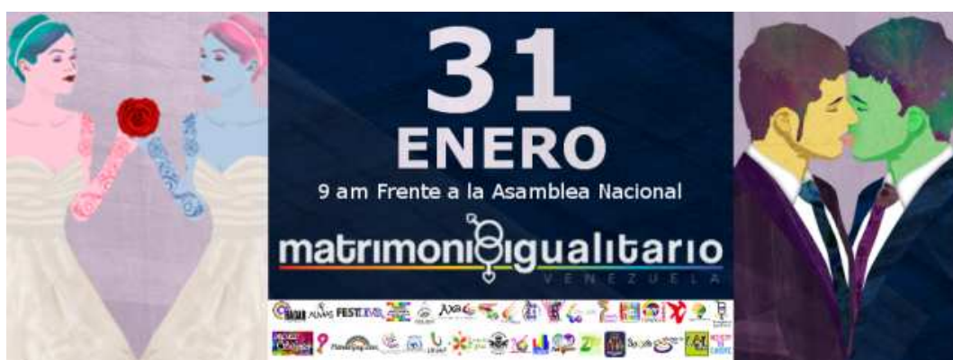
Figura 3: Afiche de la concentración para la entrega del Proyecto de Ley del Matrimonio Igualitario.

objetivo de lograr que el Estado permita contraer nupcias a personas sin discriminación por orientación sexual ni identidad o expresión de género, con iguales efectos y formas de disolución establecidos en el Código Civil (ver Figura 3). Cabe recordar que La Ley del Plan de la Patria (2013) contempla una serie de objetivos que responde a la necesidad de generar políticas y legislaciones para la comunidad sexodiversa. El apartado 2.2 estipula: "Construir una sociedad igualitaria y justa". Los ítems 2.2.4.2, 2.2.4.3 y 2.2.4.4 expresan que el Gobierno nacional debe "incorporar la perspectiva de la igualdad de género en las políticas públicas, promoviendo la no discriminación y la protección a los grupos socialmente vulnerables", "generar políticas formativas sobre la perspectiva de igualdad de género y de diversidad sexual" y "promover el debate y reflexión de los derechos de la comunidad sexo-diversa" respectivamente.