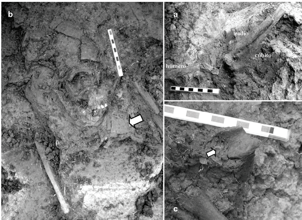
Fig. 2. a: Vista de la posición anatómica articulada de los huesos del brazo izquierdo; b: Detalle del aplastamiento y desplazamiento de piezas del cráneo (flecha indica ubicación del fragmento de cerámica sobre el tórax del individuo); c: Detalle del nódulo de ocre rojo hallado sobre el húmero izquierdo.

Considerando los indicadores etarios disponibles en la muestra, para la estimación de la edad al morir se siguieron los métodos presentados por Schehuer y Black (2000) para la fusión de las epífisis en huesos largos y el método de Brothwell (1981) que considera el desgaste dental como indicador. Si bien este último es controvertido, dado que en las poblaciones cazadoras-recolectoras el desgaste de la superficie oclusal está influenciado por el tipo de dieta y los resultados presentan grados variables de confiabilidad (Santini et al., 1990; Mays et al., 1995), se decidió utilizarlo para el individuo bajo estudio ya que no se contó con otros estimadores etarios tradicionales, como por ejemplo la obliteración de las suturas craneales (White y Folkens, 1991; Buikstra y Ubelaker, 1994). Este método no pudo aplicarse debido al grado de aplastamiento, deformación y fragmentación del cráneo, productos de procesos