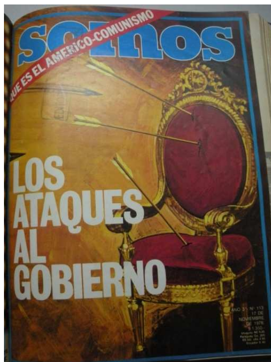
Figura 2: Somos , 17 de noviembre de 1978 (Tapa)