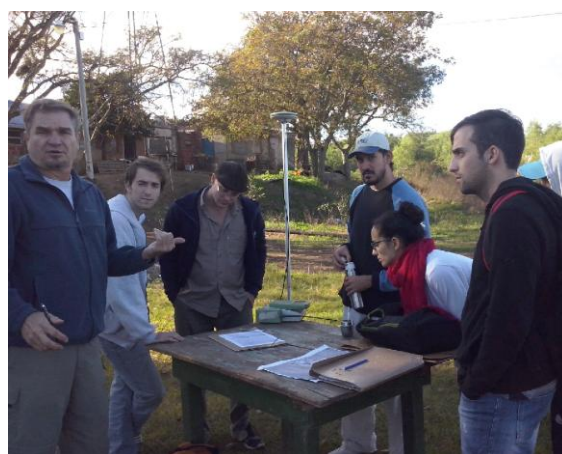
Fig. 4: Relevamiento del predio de la Escuela Rupp en la Boca.