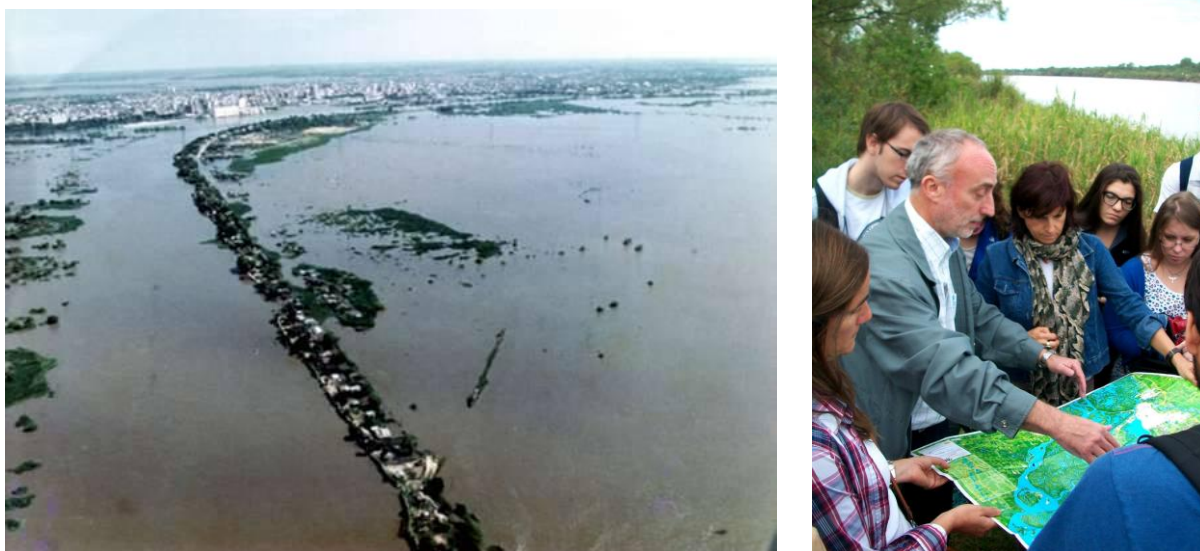
Fig. 3: Alto Verde y la Inundación de 1998. Reconocimiento del territorio y del valle de inundación del río Paraná.

La existencia de un comodato a favor de la Escuela Rupp donde la Mutual PRESAFE cede hasta el año 2017 el inmueble del antiguo Semáforo de Prefectura (ubicado en la manzana 10) originó la presentación a la Convocatoria de la SPU, con la propuesta de construcción de una pequeña infraestructura identificatoria del territorio, en la cual se propone llevar a cabo actividades de reconocimiento de patrimonio natural y cultural en el marco del PEIS Guardianes del río.