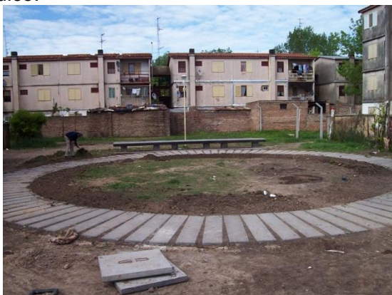
Fig. 03 MUNICIPALIDAD de Pergamino, Planeamiento, Obras y Servicios públicos, Plaza Vgen. De Guadalupe, 2005

Allí hay instalada una fricción permanente entre ambos, en ese umbral o frontera que a veces se define con mucha precisión, pero en otros tantos es borrosa, no se presenta con claridad. Se libra una confrontación permanente por el establecimiento de los límites entre lo público y lo privado en el espacio urbano. En cada caso los modos y causas son particulares, y varían de la ciudad formal, a la informal: el pasillo de una villa, construido entre una sucesión de casas, es el resultado cotidiano de pujas entre vecinos sobre el dominio del espacio común, en pleno ejercicio de la ley del más fuerte como único marco jurídico.