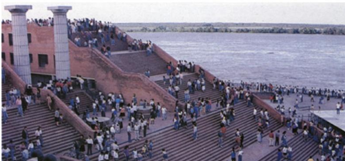
Fig. 02: Foto Parque España, Rosario, 2013

En áreas de riberas centrales donde cualquier inversión es negocio, es mayor la necesidad de disponer de proyectistas formados en su defensa. Los capitales privados pueden vulnerar el derecho de los ciudadanos a la accesibilidad libre y gratuita al espacio público. Salvo excepciones los ejercicios curriculares se desarrollan en ambos extremos: “asalto” al espacio público o “pastito” verde y democrático. Masa edificada, literalmente apoyada sobre el suelo o tierra parquizada. Resulta difícil encontrar casos donde se planteen ejercicios proyectuales que problematicen las fricciones, las oposiciones entre intereses particulares (el capital en sus formas diversas) e intereses comunes (la sociedad en su conjunto). Que exploren, investiguen un “espacio entre” los modos dominantes. Las consecuencias sociales de la ausencia de identificación del problema, devienen múltiples y variadas. Los arquitectos en su práctica, no siempre cuentan con herramientas disciplinares para ejercer la protección al espacio público en las franjas de conflictos. Ante la ausencia de visibilidad del problema por falta de formación en este sentido, se cometen los errores más grandes aún con las mejores intenciones.