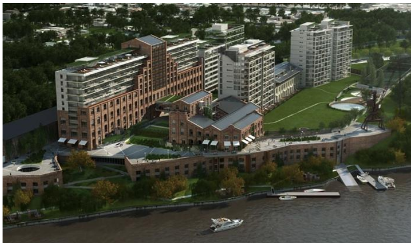
Fig. 08: Puerto Norte. Forum. Autores: MSGSSS (Manteola, Sánchez Gómez, Santos, Solsona, Sallaberry, Vinsón Arquitectos), TGLT. Render del proyecto.