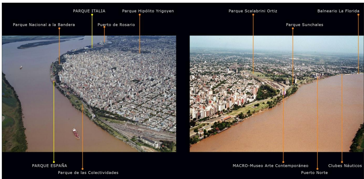
Fig. 01: Fotos aéreas de la ribera rosarina, 2012

PALABRAS CLAVES: PROYECTO; ESPACIO PÚBLICO; CONFLICTO; VULNERABLE