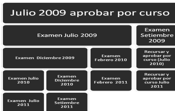
Fig. 1 Instancias de rendición de las asignaturas para el periodo de referencia Julio 2009 – Setiembre 2011.