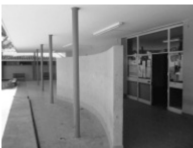
Imagen 5: La pared curva en el acceso impide el ingreso del viento norte al patio interno.

A la pregunta: ¿Usted recuerda que haya tenido en cuenta algo en especial para el diseño de este edificio de Catamarca? MRA responde: "Lo especial fue repetir la arquitectura que yo entendía que había que hacer: simple. En los pabellones tomé la precaución de orientarlos en función del viento zonda; el resto fue directamente adaptarnos a las posibilidades del terreno y que fuera lógico y sobrio". 4 (Fig. 5)