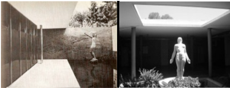
Imagen 6: El patio del pabellón de Mies y el patio del pabellón de MRA.

Estos argumentos quedan demostrados cuando observamos en el Centro de Salud la estatua de la mujer que mira al cielo; ubicada en el patio interno sobre el eje compositivo del edificio de Catamarca. No quedan dudas de que este espacio es una referencia al patio del Pabellón Alemán en la Exposición Universal en Barcelona de 1929, de su maestro: Mies van der Rohe. (Fig. 6)