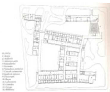
Fig. 3: Planta baja del conjunto del Centro de Salud de Catamarca.

A partir de un eje, que corre de norte a sur, se organiza el edificio. Hacia el oeste y el este se encuentran los dos pabellones de mayor superficie que contienen los consultorios. Estos son de una sola planta con el techo con caída hacia el interior de la manzana.