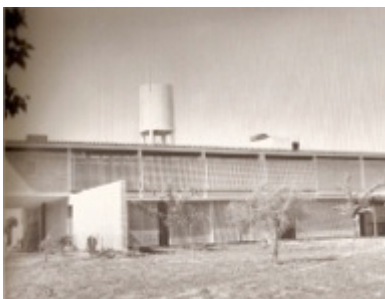
Fig. 4: Fachada Sur sobre calle Mota Botello.

Sobre calle Mota Botello –al sur–, se encuentra el pabellón en el que se sitúan los servicios y que, junto a una galería larga, ayudan a conformar el patio exterior central ubicado en el corazón de manzana. (Fig. 4)