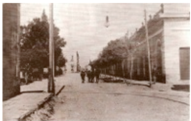
Fig. 2: La ciudad de Catamarca a principios del siglo XX.