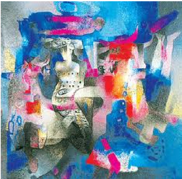
Detalle del Mural "Natura VII" / Fabricio LARA, pintor boliviano