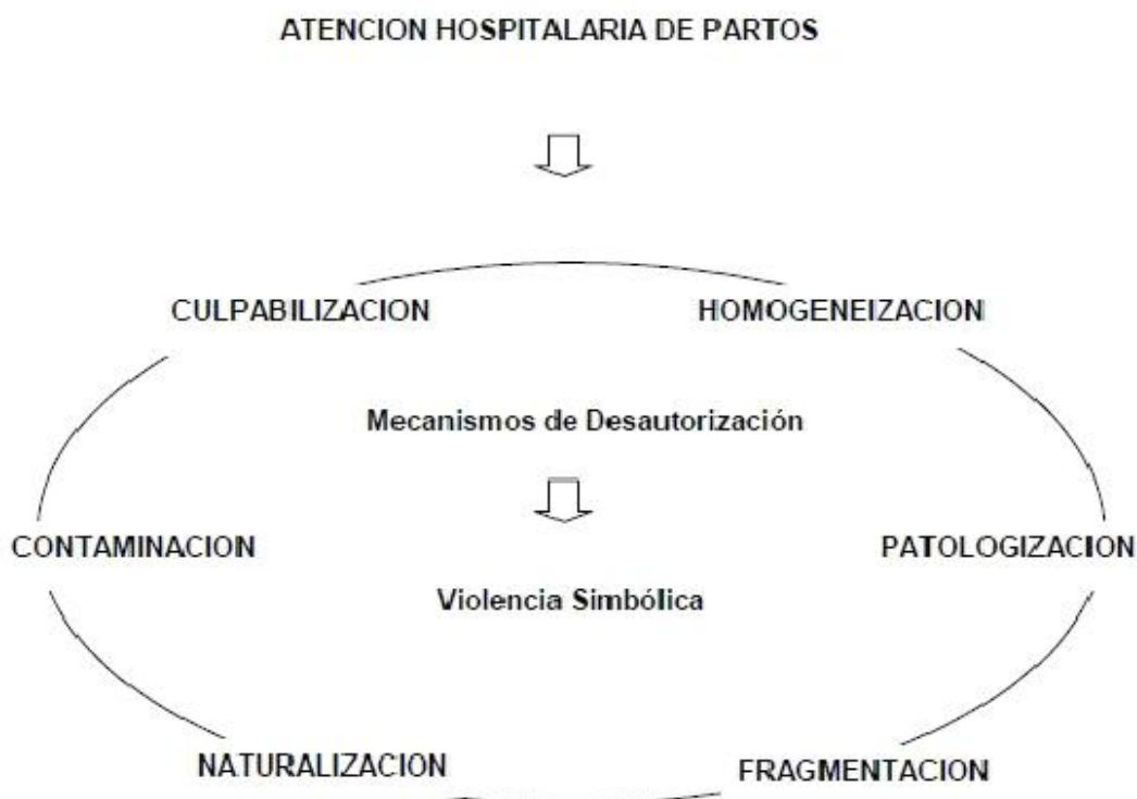
Figura 1. Esquema que resume la propuesta de Sadler (2004)

Lo que define la localización hospitalaria y sanitaria (porque podemos incluir aquí los primeros niveles de atención que se dan en salitas y en unidades sanitarias) es la ejecución de prácticas de intervención rutinarias 8 advertibles, por ejemplo, en la atención del parto, que implican una serie de mecanismos de desautorización de la parturienta (Sadler, 2004) y de poder simbólico relativo a la mujer (Fornes, 2009).