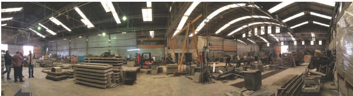
Fig. 9 Taller de producción de la empresa AGL Premoldeados

Impacto en la Cámara Argentina de la Construcción y su área de influencia una vez que el proyecto se completa, debido a una serie de actividades de difusión planificadas.