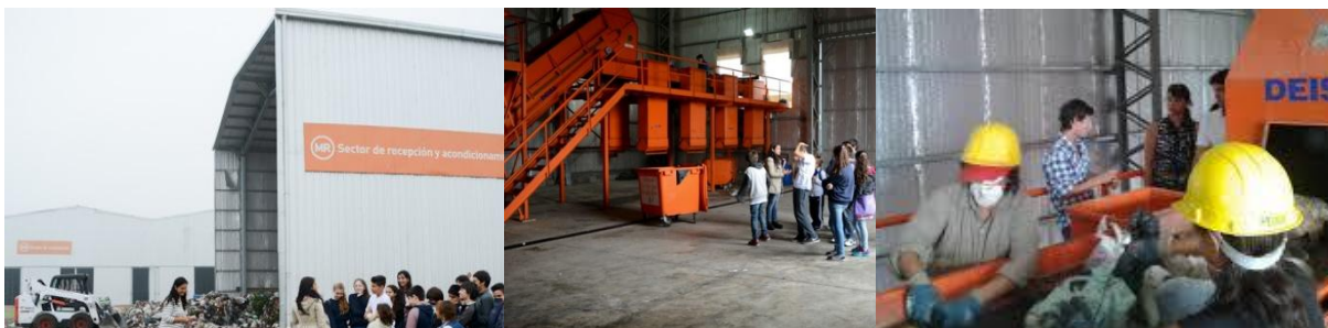
Fig. 5 Actividades municipales relacionadas con empresas y cooperativas de trabajo.

La recolección, separación, clasificación y molienda de los residuos plásticos reciclables son actividades relacionadas con la Municipalidad, de los emprendimientos vinculados a ella. En dicho proceso se acuerda la importancia de la reutilización del reciclado para generar un nuevo material (hormigones no convencionales), el cual será utilizado en la fabricación de elementos urbanos y en el uso como hormigón de relleno en pliego municipales de la obra pública.