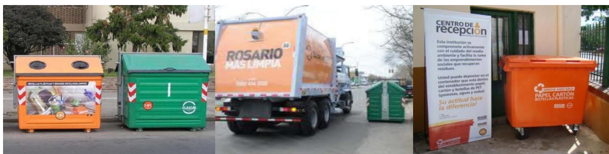
Fig. 1, 2 y 3 Sistema de separación y recolección de residuos

Este problema se agrava de forma constante por el gran crecimiento habitacional y desarrollo productivo a nivel regional que tiene la ciudad de Rosario y su área metropolitana. Ante esta situación, la Municipalidad de Rosario, cuenta con el sistema de recolección general de RSU y con el programa SEPARE promoviendo ante la población la concientización de separar los residuos en origen y sosteniendo con diferentes acciones los emprendimientos de recuperadores y clasificadores. Así se obtienen grandes volúmenes de residuos reciclables secos entre los cuales se encuentran los plásticos.