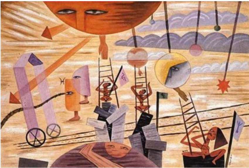
Puerta del Este, 1935. (Pintura)