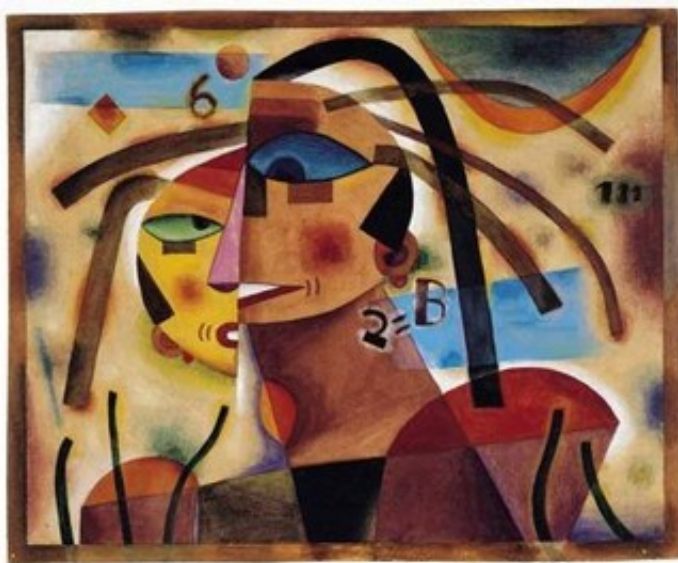
Pareja, 1923. (Pintura)