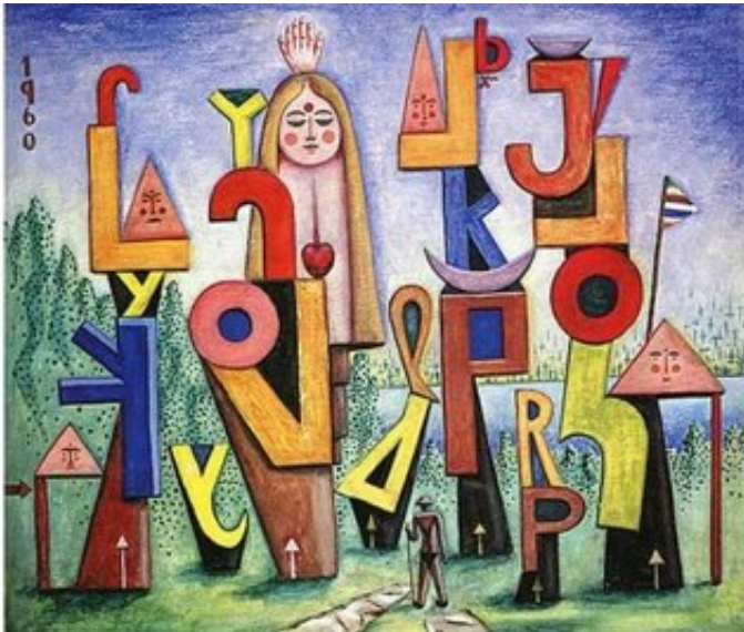
Rótulo, 1960 (Pintura)