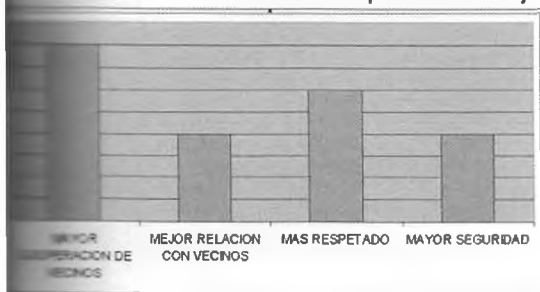
Expectativas de reconocimiento desde la valorización del puesto de trabajo.

A efectos de estudiar el puesto de trabajo se analiza la carga individual