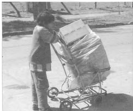
Niño recuperador urbano. Transporte de materiales, recurso: silla recuperada.

Fondo documental Taller de Diseño Industrial IV-B. Agosto 2005.