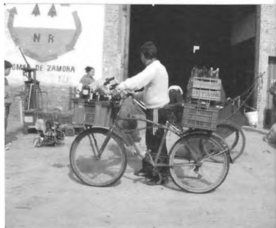
Recuperador urbano. Transporte de materiales, recurso bicicleta.

Fondo documental Taller de Diseño Industrial IV-B. Agosto 2005.