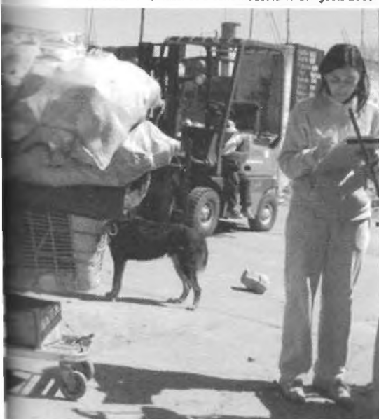
Recuperador urbano. Transporte de materiales, recurso: carro de supermercado recuperado. Fondo documental Taller de Diseño Industrial IV-B. Agosto 2005.

La atención de los resultados obtenidos permite avanzar en las etapas de desarrollo del proyecto y prototipeado a fin de construir un caso de transferencia replicable.