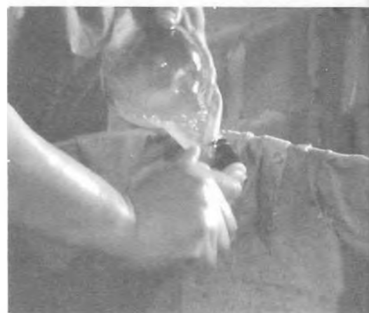
Lavado de botellas y retirado de etiquetas, etapa de agregado de valor.

Fondo documental Taller de Diseño Industrial IV-B. Agosto 2005.