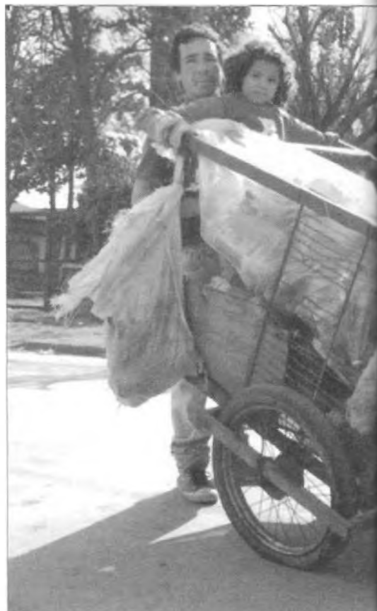
Recuperador urbano. Transporte de materiales, sistema de empuje.

El proyecto articula el diseño y la producción del herramental necesario para actuar sobre los problemas de recolección, selección, procesa-