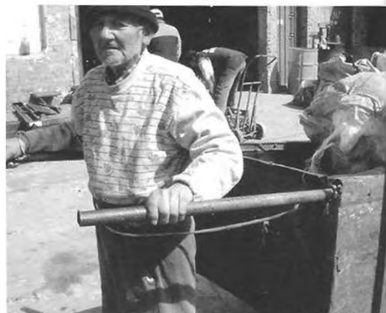
Recuperador urbano. Transporte de materiales, tracción humana.

El reciclado de residuos sólidos urbanos es una preocupación central en muchos países del mundo con diversos contextos políticos, sociales y económicos. El reciclado como actividad sistemática, en muchos sitios del globo, responde a planteos de política nacional, para la cual existen normas, presupuestos, legislación y un período establecido para la