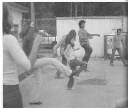
Talleres de Arte y Comunicación. Agosto-Diciembre 2005. Taller de Murga, en Sicardi.