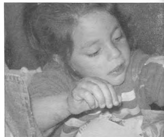
Talleres de Arte y Comunicación. Agosto-Diciembre 2005. Taller de Manchas, en Correa.