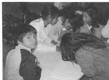
Talleres de Arte y Comunicación. Agosto-Diciembre 2005. Taller de Dibujo y Pintura, en Montoro.