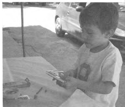
Talleres de Arte y Comunicación. Agosto-Diciembre 2005. Taller de Dibujo y Pintura, en Correa.