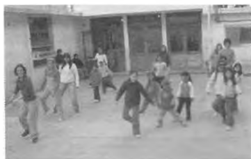
Talleres de Arte y Comunicación. Agosto-Diciembre 2005. Taller de Murga, en Sicardi.

Esta primera jornada de la universidad en el barrio sirvió para diagnosticar las posibilidades de trabajo y para consolidar las relaciones con los distintos agentes y referentes de la comunidad. Tanto los asistentes