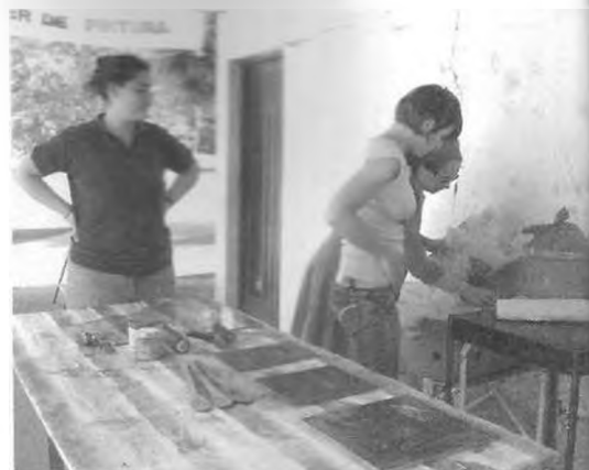
Talleres de Arte y Comunicación. Agosto-Diciembre 2005. Taller de Grabado, en Correa.

Este año, la idea es invitar a quienes ya hayan participado en las actividades del 2005 a sumarse a las actividades en el otro barrio y así consolidar la interacción barrial. A final de año, el proyecto prevé la realización de una exposición de todo lo actuado, en un centro cultural