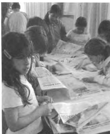
Talleres de Arte y Comunicación. Agosto-Diciembre 2005. Taller de Periodismo.