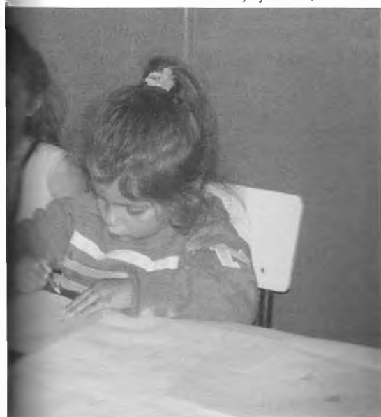
Talleres de Arte y Comunicación. Agosto-Diciembre 2005. Taller de Dibujo y Pintura, en Sicardi.

considerar esencial la creación de un espacio de intercambio en donde los integrantes de la comunidad tengan la posibilidad de aprehender el conocimiento de especialistas en cada área elegida y transmitir sus propios saberes, para de esta manera enriquecer su formación y estrechar su vínculo con la comunidad y las instituciones.