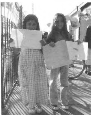
Talleres de Arte y Comunicación. Agosto-Diciembre 2005. Exposición de Trabajos en el Casco de Villa Elvira.