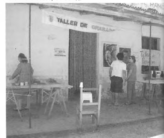
Talleres de Arte y Comunicación. Agosto-Diciembre 2005. Taller de Grabado, en Correa.