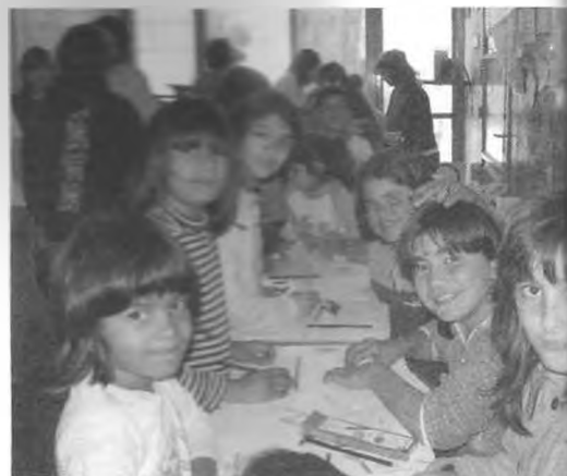
Talleres de Arte y Comunicación. Agosto-Diciembre 2005. Taller de Dibujo y Pintura, en Montoro.

La creación de una propuesta de estas características surge de