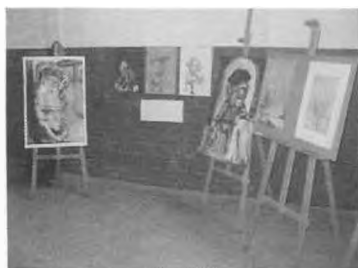
ExpoUniversidad 2005. Jornada 6 de Septiembre en Villa Elvira. Exposición de Trabajos