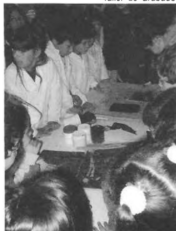
ExpoUniversidad 2005. Jornada 6 de Septiembre en Villa Elvira. Taller de Grabado.

del casco urbano de la ciudad de La Plata, a la que se invitará a todos los participantes. Además, realizaremos visitas guiadas a centros culturales del casco urbano platense y de los barrios que intervienen, cuyo acceso sea fácil y económico, para consolidar el intercambio y propiciar la continuidad de la integración.