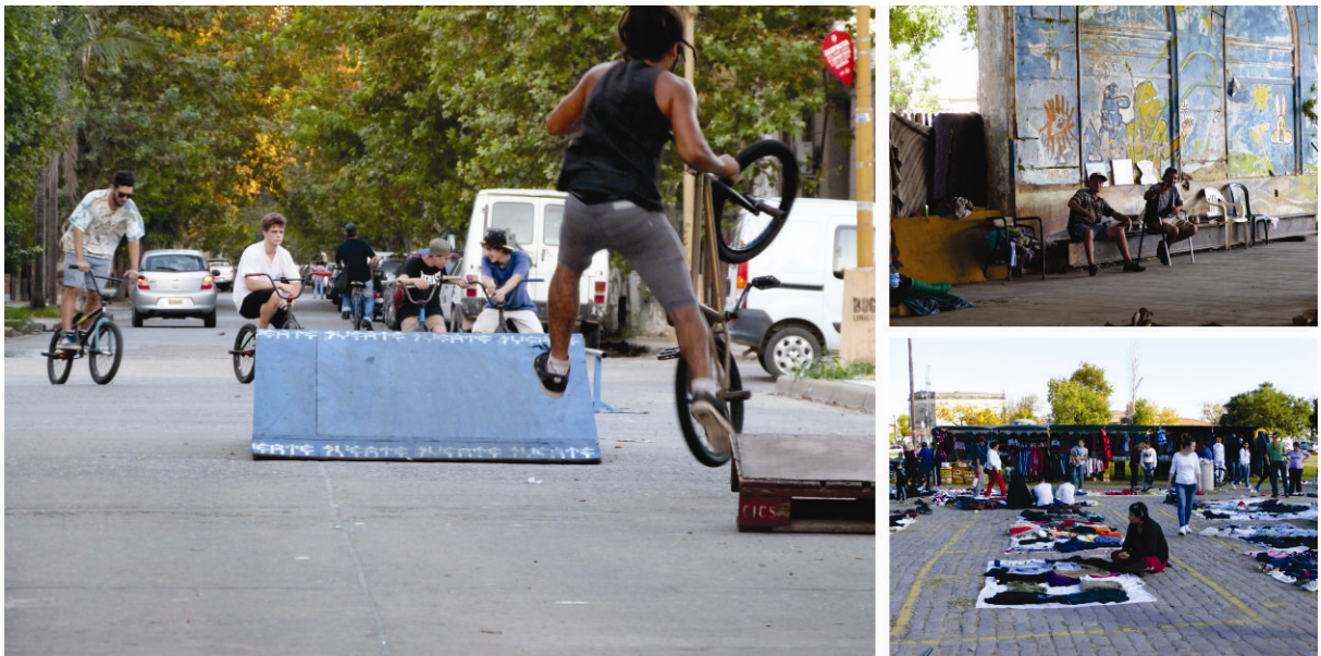
Fig. 1: Usos emergentes como consecuencia del sujeto contemporáneo. Tomada en Molino Franchino.

Estos dos lugares se definen desde los usos emergentes (como consecuencia del sujeto contemporáneo) o desde la supervivencia (como consecuencia de la precariedad) en un contexto de marginalidad y exclusión que promueve la ocupación temporal del espacio público como una alternativa de supervivencia.