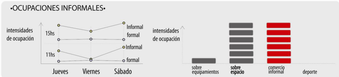
Fig. 8: Cartografía urbana desarrollada en Estación Mitre en el ámbito de la investigación.