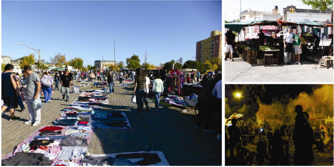
Fig. 5, 6 y 7: Apropiaciones informales en ex Estación Mitre.