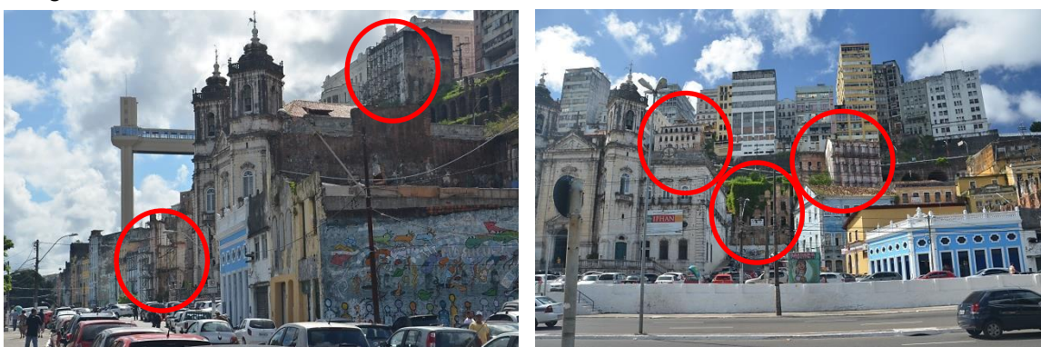
Figura 02. Exemplos de degradação de edifícios no centro antigo de Salvador.

A Figura 02 mostra alguns exemplos de degradação de edifícios no centro antigo de Salvador nas proximidades de bens tombados, ratificando o abandono da área central pela população de Salvador. Na fotografia da esquerda, observamos que, junto ao Elevador Lacerda, existem edificações com escoras, em estado de ruína e abandono. O mesmo ocorre em edificações próximas da Basílica da Conceição da Praia 2 , como mostrado na fotografia da direita e como encontrado em outros locais do centro histórico.