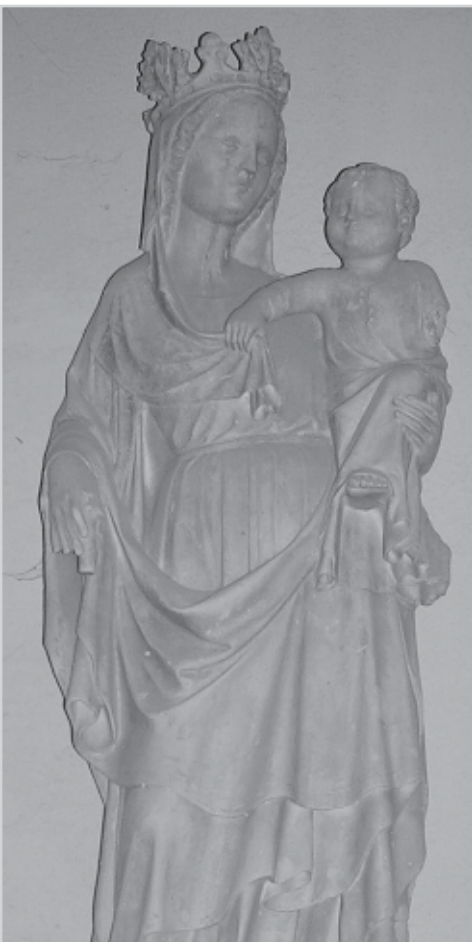
La Virgen con el niño Arte gótico Medidas: 1, 10 X 0, 36 X 0, 22 cm.