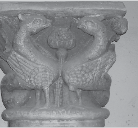
Capitel con animales fantásticos Arte románico. Medidas: 0, 57 X 0, 57 X 0, 43 cm.