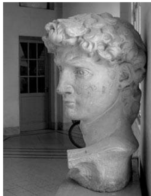
La Cabeza del David

El personal especializado del Área de Museo está capacitado para resolver asesoramientos diversos. Un ejemplo de esta tarea es la catalogación y estudio crítico de las obras que se llevó a cabo con el acervo patrimonial del Colegio de Abogados de La Plata. Se trata de una destacada colección de pinturas de arte argentino contemporáneo formada mediante el sistema de Premios Adquisición en la realización de los diversos Salones que la Institución gestiona desde