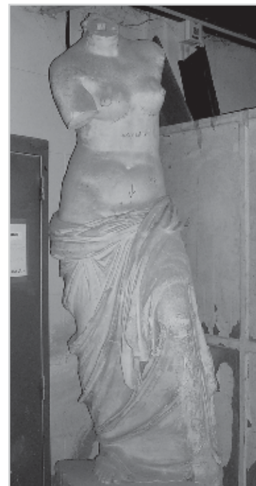
Venus de Milo

Ubicación del original: Academia de Florencia.