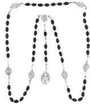
Collar de la Coronilla Servita.

Las estampitas se basaron en una profunda investigación de la historia del arte. El formato es de acordeón y lleva como tapa el corazón de la Virgen con las siete espadas; en la contratapa, la letra del "Himno de la Virgen de los Siete Dolores". En un lado del acordeón están las ilustraciones de los Siete Dolores basados en diseños de las esculturas; en el otro, se encuentran los rosetones de mosaicos.