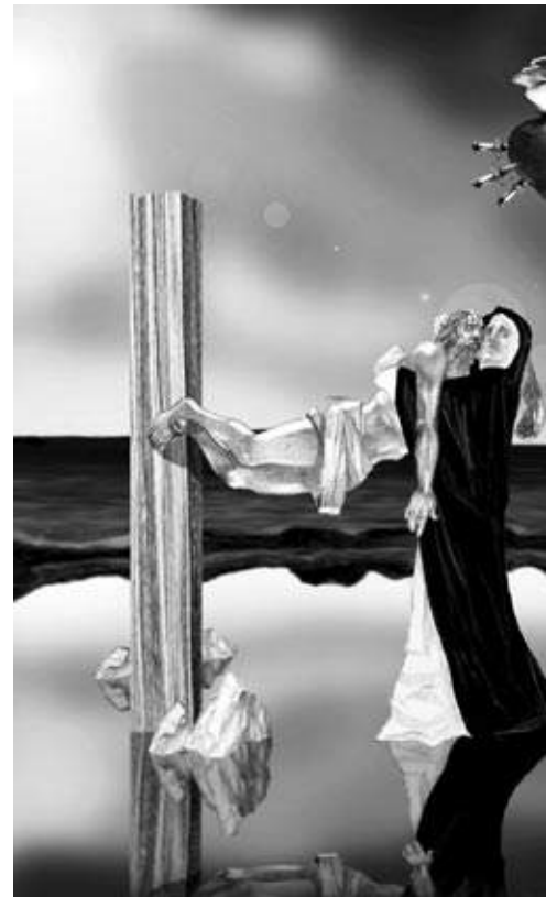
Estampa del Sexto Dolor.

Otra vez la Facultad de Bellas Artes aportando a la cultura de los pueblos. X