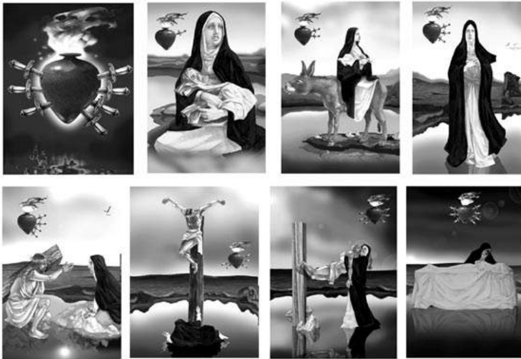
Estampitas de los Siete Dolores.

En los meses de julio, agosto y septiembre de 2007, se diseñó la totalidad del circuito; se realizaron 8 esculturas de gran porte (acabado en cemento y revestimiento para exteriores); se produjeron los 7 medallones de mosaicos artísticos; se crearon las ilustraciones de los Siete Dolores adaptados a las esculturas; se hizo el diseño y la impresión de estampitas; se compuso y se grabó el "Himno de la Virgen de los Siete Dolores"; se diseñaron y montaron los muelles; se colocó la iluminación del circuito y se diseñó y montó la gráfica del circuito para su presentación en sociedad.