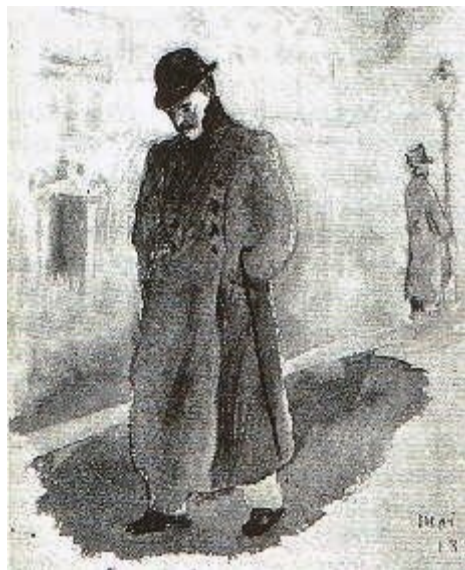
Auto-retrato de Paul Valéry 1

busca o valor do espírito humano e observa seu funcionamento, seu pensar, para construir por meio de operações escritoras (leitura pela escrita e escrita pela leitura). Capturas de forças que aproximam percepção e criação. Estas forças operativas servem como impulso para uma trajetória autoconsciente do espírito que se aventura em busca do novo. Novidade que gera inquietude, pois caça em meios múltiplos de escrita — rigorosa e complexa — desdobramentos enigmáticos à exatidão dos sentidos. Ou a casa-corpo onde habita a geometria que mede o mundo, e “dá as verdadeiras referências do prazer e guia o espírito” (VALÉRY, 1996, p. 8).