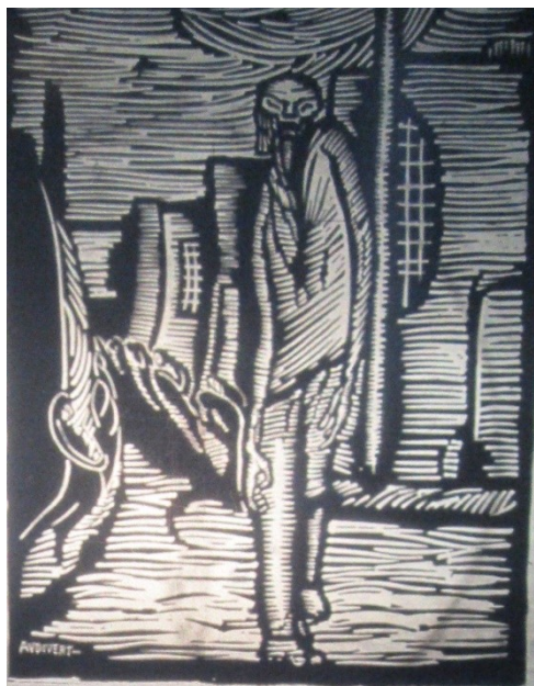
Imagen 3: Ilustración de Audivert sobre el poema “Sub-Drama”

Al igual que la literatura, Revista de Oriente reproduce y difunde artistas plásticos, es decir pintores, grabadores, escultores. La mayoría de sus portadas están realizadas por grabadores y pintores como Pompeyo Audivert y Jose Planas Casas quienes en los años '30 serán participantes del movimiento anarquista. No solo en las tapas del proyecto se observa la relevancia otorgada al arte, existen artículos en los cuales se reconoce a artistas y sus obras.