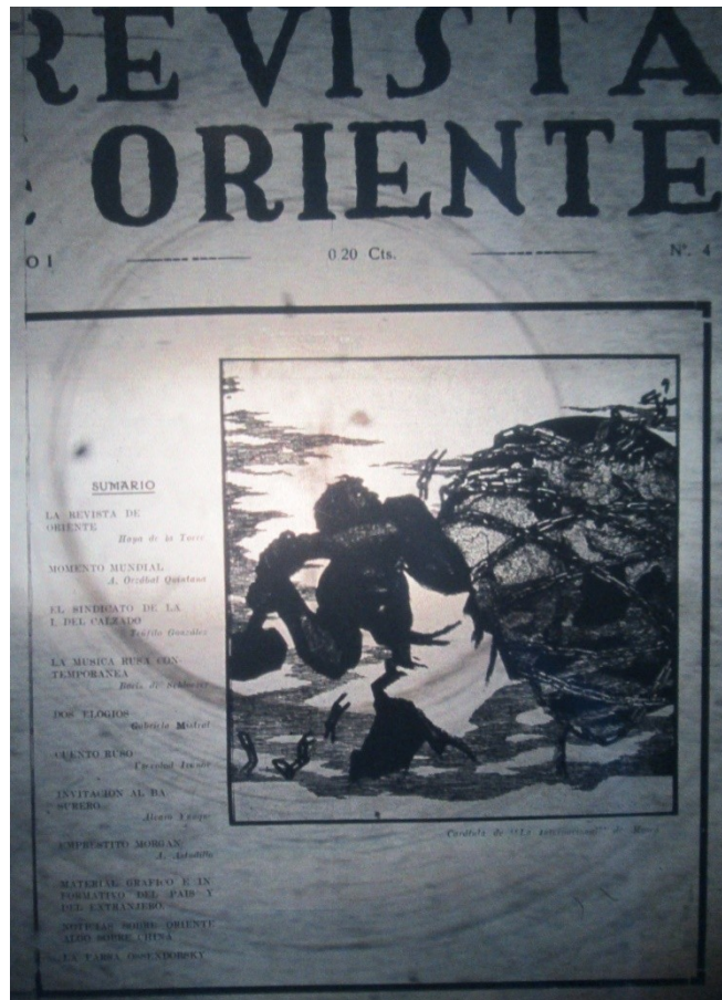
Imagen 2: Tapa del número 2 de la Revista de Oriente .

Al mismo tiempo, los artistas vanguardistas europeos que habían surgido hacia fines del siglo XIX apoyaron la Revolución Bolchevique y, en el caso de los artistas rusos, a partir del fomento obtenido desde el gobierno soviético, participan activamente en el Estado. Estos artistas, como Malévich o Tatlin, están inspirados por el expresionismo, el futurismo y el cubismo. Aunque la corriente artística que se estableció con más fuerza fue el constructivismo cuyo mayor exponente fue Tatlin. Antes de la Revolución Bolchevique, el campo artístico Ruso había hecho ecos del futurismo italiano de Marinetti, que tenía como principal objetivo la búsqueda de encontrar una expresión artística capaz de reflejar la sociedad moderna, es decir las nuevas técnicas y el uso de la máquina en la vida cotidiana con las transformaciones que esto implicaba.