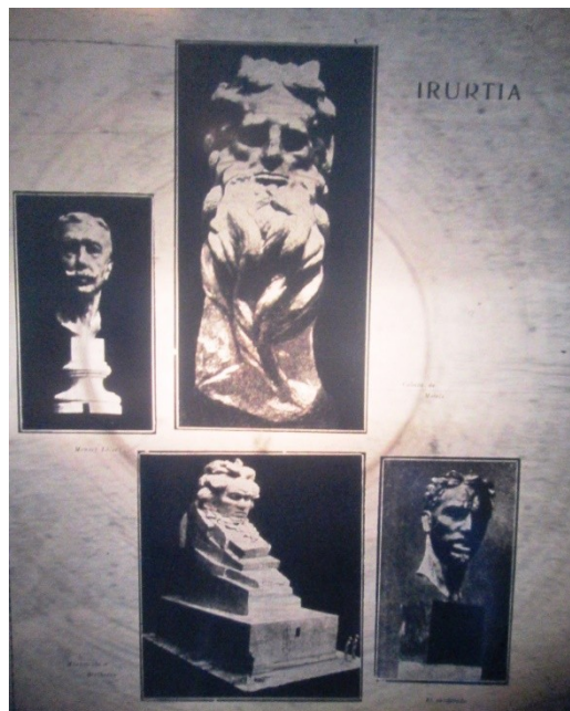
Imagen 4: Fotografías de la obra Rogelio Irurtia que acompañan al artículo “Irurtia”

Esta es una de las explicitaciones acerca del concepto y la relevancia que el proyecto editorial le otorga al arte. Su principal objetivo era la difusión de la realidad soviética y la mejora de las condiciones de vida de los obreros. Estos objetivos en todos los números de la publicación se reafirman, el arte no solo le permite ilustrar, en el caso de los relatos literarios rusos, la situación en la U.R.S.S, sino que al reproducir obras de los diferentes tipos de manifestaciones se busca enriquecer espiritualmente a los sectores obreros.