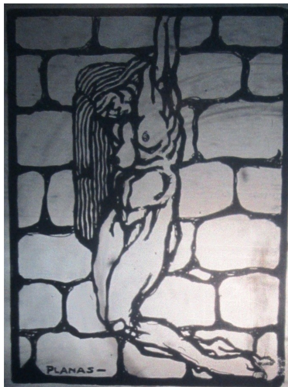
Imagen 5: Ilustración de Planas para un artículo titulado “La Prostitución”

La manifestación artística, de esta manera es una de las cuestiones fundamentales en Revista de Oriente , ya sea para elevar culturalmente a los obreros como para expandir su número de lectores. Esta característica coincide con el proyecto que se llevaba adelante en Rusia luego de la Revolución Bolchevique. Es decir, la creación de museos, muestras y apoyo a los artistas del país y el acceso de esto a los trabajadores para instruirlos y mejorar su espectro cultural. A partir de esto, es posible afirmar que a pesar de que la estética no imita las vanguardias rusas, el objetivo del uso del arte y la cultura como medio para llegar a los trabajadores es tomado por este proyecto editorial para alcanzar la difusión de sus propuestas políticas y sociales.