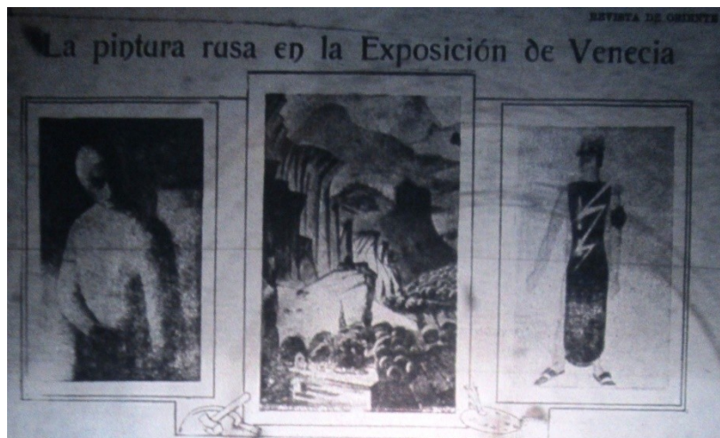
Reproducción de obras rusas.

Esto es acompañado por el movimiento conocido como Proletkult que propone sustituir la cultura burguesa por la cultura proletaria. Bogdanov es quien con el apoyo de Lunatcharsky, considera necesario para la transformación de la sociedad el despliegue de la vía cultural, además de la política y económica. La revista en cuanto a las temáticas trabajadas y estilo se relaciona con el movimiento Proletkult que se desarrolla en Rusia durante el período revolucionario y luego del establecimiento de la U.R.S.S. Surge desde los sindicatos y los comités que funcionan en las industrias y despliegan sus propios modos de instruir a sus obreros.