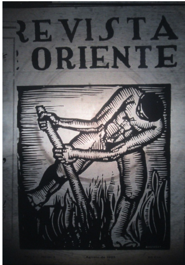
Imagen 1: Tapa del número 2 de la Revista de Oriente realizada por Pompeyo Audivert

Las portadas de las revistas ilustran, casi en todos sus números, este último objetivo, ya que aparecen en ellas representaciones de trabajadores exaltando o remarcando el físico de estos mientras realizan alguna tarea como labrar o martillar. Esta característica no es una propuesta original por la Revista de Oriente , al menos si la comparamos con las políticas llevadas adelante en la U.R.S.S. durante los años '20. El Comisario de Instrucción Pública, Anatole Lunatcharsky, es el principal movilizador de la extensión cultural entre los intelectuales y artistas y los obreros, mediante la creación de centros culturales, museos y bibliotecas además de eventos como exposiciones, inauguraciones de monumentos y desfiles.