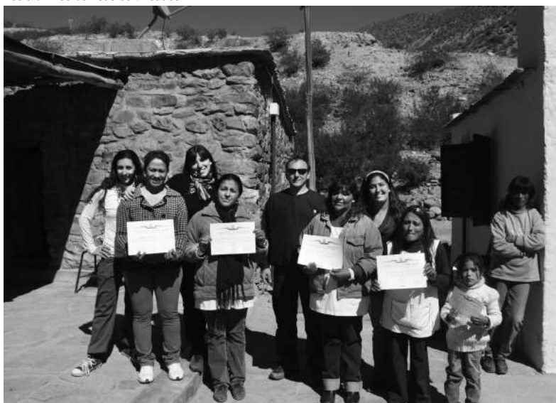
Los directivos y docentes de la escuela junto al grupo de trabajo de la Facultad