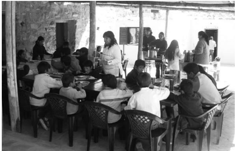
Alumnos y profesores, durante el almuerzo