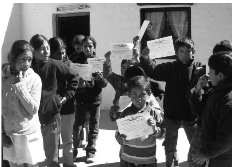
Los alumnos con sus certificados