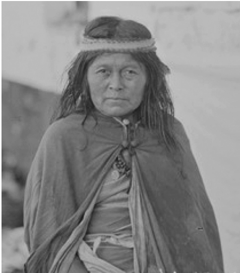
3 Mujer de Inacayal.

desconoce el motivo por el cual en 1994 la medida de restitución recayó solo sobre los restos óseos.