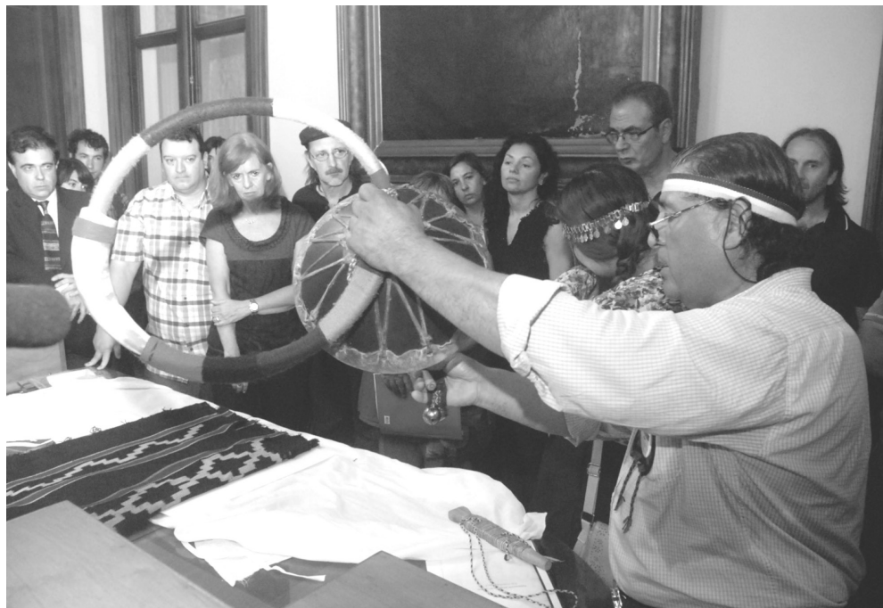
5 Ceremonia de restitución en la sala de Consejo del MLP. 9 de Diciembre de 2014

Los representantes fueron informados de las técnicas a aplicar y dieron consentimiento a gran parte de ellas.