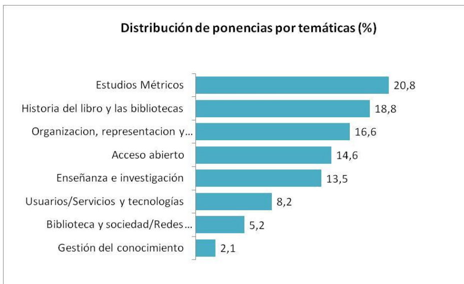
Figura 3 Temáticas de las ponencias de JIRIB 2010-2015

Fuente: elaboración propia. Las denominaciones de temas responden a los nombres de las mesas de las sucesivas Jornadas y no se basan en ningún esquema de vocabulario normalizado.