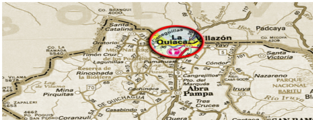
Ilustración 2.-La Quiaca una de las ciudades fronterizas de Argentina 12

Son cinco pasos limítrofes: Salvador Mazza-Yacuiba, Aguas Blancas-Bermejo, Puerto Chalanas-Bermejo, El Condado-La Mamora y La Quiaca-Villazón.