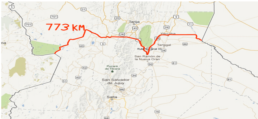
Ilustración 1.-La línea divisoria y límite que divide a los dos países (Bolivia y Argentina) 11

allí siguiendo el curso de este río hasta Hito Esmeralda que es el punto limítrofe tripartito entre Argentina, Paraguay y Bolivia. 10