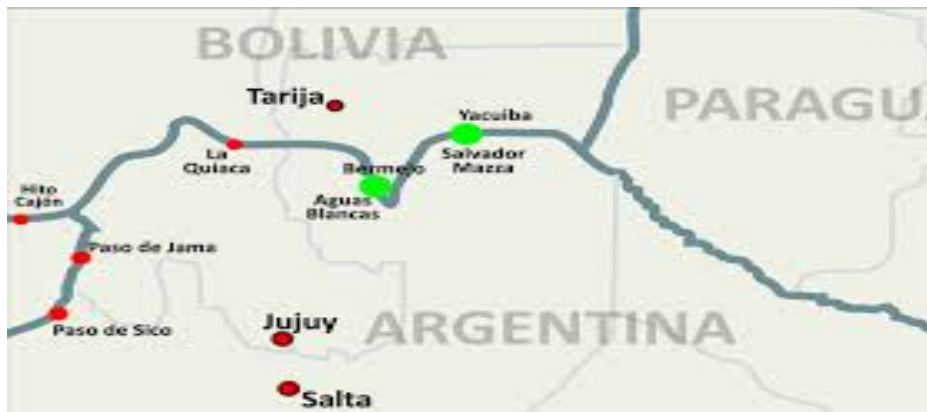
Ilustración 4.-Las principales ciudades fronterizas. 35

Salvador Mazza es una localidad donde solo existe la actividad comercial. No hay industrias y solo se brindan los servicios indispensables.