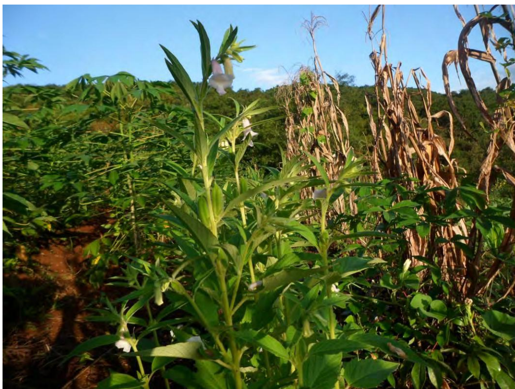
FIGURA 3. Policultivo de milho, mandioca, gergelim, caxi e fava de verão.

Portanto, de 2012 em diante houve um aumento na agrobiodiversidade cultivada pela família Rauber (tabela 1). Passaram a ser cultivadas 18 espécies de plantas diferentes, e 10 espécies que já eram cultivadas foram incrementadas com outras variedades da mesma espécie, aumentando assim a variabilidade genética.