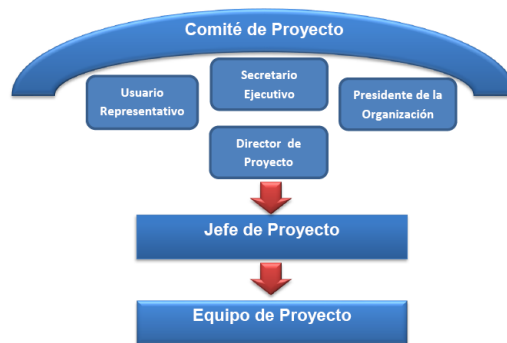
Fig. 1. Equipo de gestión de la propuesta metodológica.

La propuesta metodológica está constituida por fases y componentes, e identifica una estructura organizativa con roles y responsabilidades bien definidas para gestionar los proyectos de TICs (ver Figura 1). Los roles y responsabilidades se definen a través de la estructura establecida por PRINCE2, que por ser jerárquica, es la que más se adapta a las necesidades particulares y al entorno de la Administración Pública. Por el contrario, la estructura de METRICAV3 está muy enfocada en el desarrollo de productos de software y por otro lado, APM, establece una estructura tipo “hub” imposible de aplicar en un entorno particular de la administración pública. Por otra parte, esta estructura involucra a las autoridades, dentro del Comité de Proyecto, para lograr compromiso, responsabilidad, involucramiento y respaldo, al Jefe de Proyecto y a su equipo.