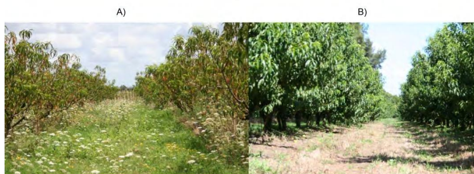
FIGURA 1. Fotos de montes de Prunus persica , donde A) corresponde al monte agroecológico y B) el monte convencional. Enero, 2015. Montevideo.

Se seleccionaron dos productores frutícolas del departamento de Montevideo, procurando que los manejos fueran diferentes. Uno de ellos se encuentra certificado por la Red de Agroecología, y adopta por lo tanto los principios agroecológicos, mientras que el otro es productor convencional. El estudio se centró en sistemas frutícolas de durazno ( Prunus persica ) (Figura 1). Se caracterizó el manejo de cada sistema para contrastarlos (Tabla 1).