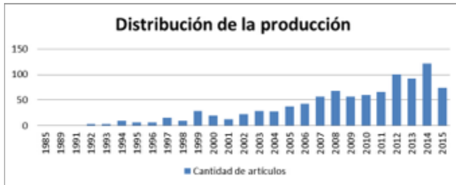
Figura 1. Distribución de la producción.

EDITORIAL MATERIAL OR REPRINT). Esto permitió recuperar 979 documentos del periodo 1985-2015 (Figura 1) relativos a imágenes satelitales de alta resolución vinculadas a bosques.