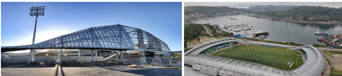
Estadio Chinquihue, Puerto Montt, Chile, Cristian Fernández, Arquitectos, 2013

La dimensión urbana y colectiva, la expresión de un uso en multitud están en este proyecto que busca indudablemente representar lo público; una noción cuyo sentido debemos replantear constantemente. Las olimpiadas, exposiciones o torneos mundiales son ocasiones para la representación de los países y en este caso, los arquitectos colombianos demuestran que es posible disponer de la tecnología necesaria al programa arquitectónico.