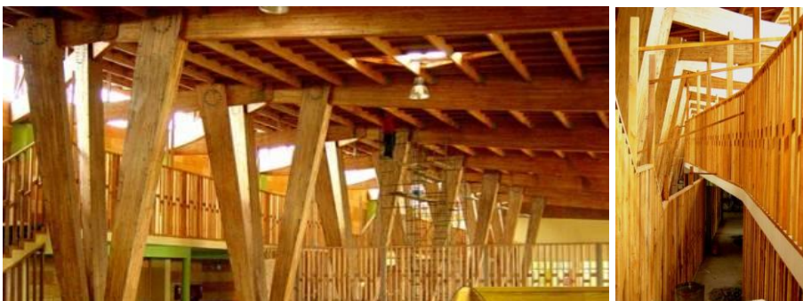
J. Lobos + Asociado, Escuela Pudeto, Chiloé, Chile, 2004

La obra de arte está en la totalidad; en ese funcionamiento indivisible que define la “unidad arquitectónica”. La casa destaca su naturaleza artificial, estética, técnica y tecnológica compitiendo con la naturaleza y sus leyes. Una exquisitez para un cliente singular que recuerda aquella sofisticación de las casas de Neutra en el desierto.