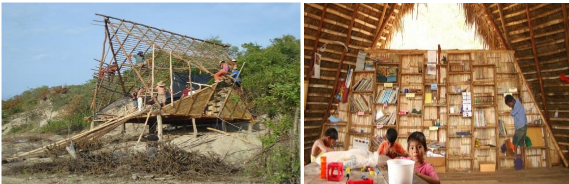
Escuela Nueva Esperanza, Puerto Cabuyal, Manabí, Ecuador, Al Borde arquitectos (David Barragán), 2009.

Queda claro que la obra arquitectónica para Lobos empieza después de conocer perfectamente los puntos de partida significantes para la comunidad, condiciones que reinterpreta y actualiza en su obra creadora.