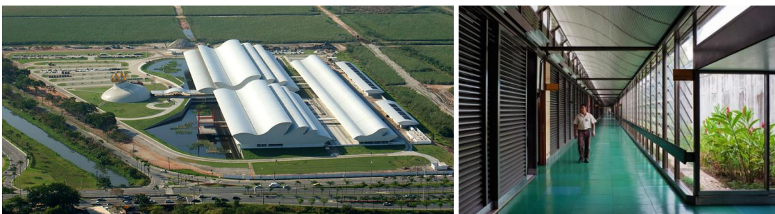
Joao Filgueiras Lima, Hospital Sara Kubischek, Río de Janeiro, Brasil, 2003

Frente a las posiciones extremas que buscan con vehemencia la exaltación de los últimos logros de la tecnología disponible, existen otras posturas que sostienen que los alcances tecnológicos deben aplicarse a la resolución de problemas sociales. En este último caso, no podemos dejar de mencionar la serie de hospitales Sara Kubischek construidos desde el estado brasileño por Filgueiras Lima (conocido como Lelé). 12 Estas obras se enlazan a varias tradiciones distintas: por un lado a los esquemas de flexibilidad de usos a partir de unidades repetitivas en una estructura de trama (sólidos y vacíos alternados), por otro lado, a la tradición de arquitectura hospitalaria, altamente definida técnicamente, con singulares demandas de ambientación, que en sí mismo conlleva la necesidad de definir módulos.