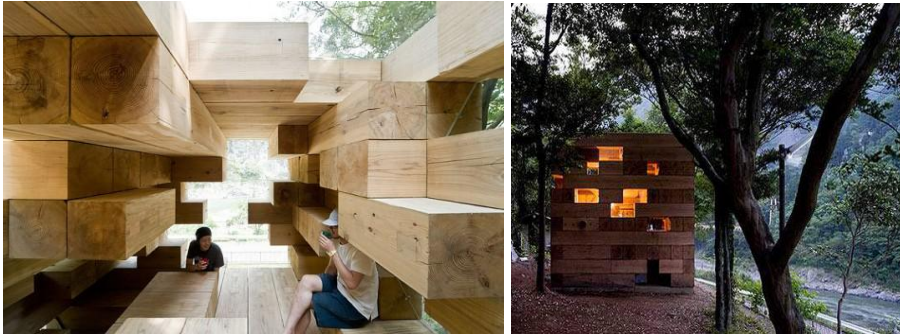
Sou Fujimoto, final wooden house, Kumamoto, Japón, 2005-2008.

Para valorar mejor este aporte a la historia y a la cultura arquitectónica, conviene relacionar la obra con un caso que se impone una indagación similar en torno a un único elemento. Sou Fujimoto contemporáneamente estudiaba las posibilidades de un módulo sólido de madera, fijando sus medidas (tamaño) para que funcione como banco, cama, repisa. Su dimensión fue elegida en sentido análogo al modulator de Le Corbusier tratando de definir medidas estándares (ergonómicas, en un sentido) en lugar de seguir una escala matemática. El módulo se apila de diferentes maneras generando un juego espacial que se conforma en un refugio de la naturaleza exterior difícil de imaginar para la vida cotidiana. Esta opción no posee las cualidades susceptibles de repetición de la casa Pentimento resultando un vacío escultórico. Una solución de elucubrada prefiguración que no define un sistema constructivo ni una tipología para la vivienda de uso diario y permanece como “obra de arte”; una escultura de sofisticado montaje que no va más allá de ese juego arquitectónico del espacio.