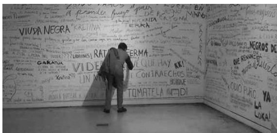
Figura 4. Diarios del odio (2014), Roberto Jacoby

El otro caso, Diarios del odio , de Jacoby, 4 se trata de una intervención realizada en la Casa de la Cultura del Fondo Nacional de las Artes en octubre del 2014 [Figura 4]. Esta obra plantea la utilización de archivos inusuales: aquellos provistos por los comentarios de lectores de diarios en versión digital. Este acervo es tomado por el artista y puesto en conjunto para potenciar poéticamente su impacto.