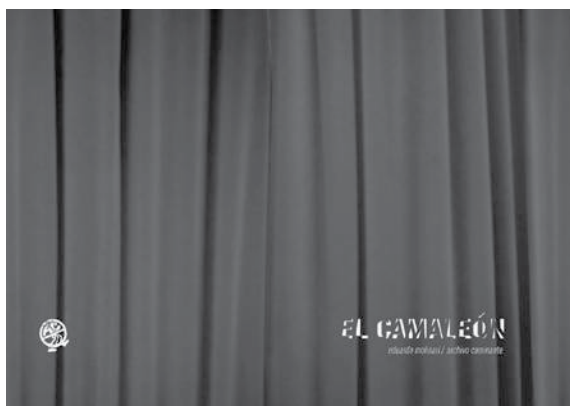
Figura 2. El Camaleón (2011), Eduardo Molinari

coincidieron temporalmente, tampoco en su soporte, ni en su circulación. Montar estas diferentes visualidades le permite activar una mirada crítica que se pone en juego cuando el espectador se deja sorprender. También, permite crear una constelación, en el sentido benjaminiano, a través de documentos poéticos que develan los trucos de magia que nos atraviesan «en nuestras vidas contemporáneas al interior del semiocapitalismo» (Archivo Caminante, 2011).