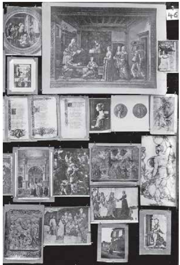
Figura 1. Detalle del Panel 46 (1927-1929), Aby Warburg