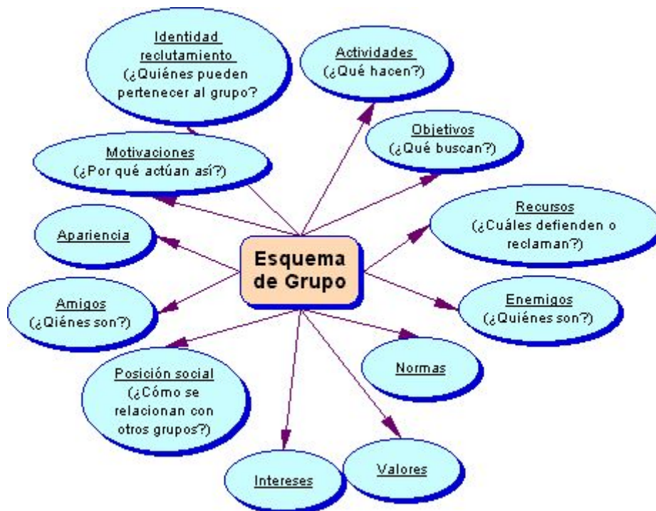
Ilustración 1- Categorías del Esquema de grupo

“Los esquemas de la memoria caracterizan a las personas con quienes interactuamos y las situaciones sociales en que participamos. Estos esquemas nos proporcionan estereotipos sociales, conocimiento sobre las personas y situaciones típicas que esperamos encontrar (...). Pero a pesar del hecho de que la gente real no encaja bien en las clasificaciones simples estereotipadas (...) nuestros modelos del mundo y de las demás personas parecen gobernar nuestras expectativas y nuestras percepciones, aunque las categorizaciones simplifiquen en exceso, aunque en muchos casos sean erróneas.” (Lindsay y Norman, 1983: 702-704).