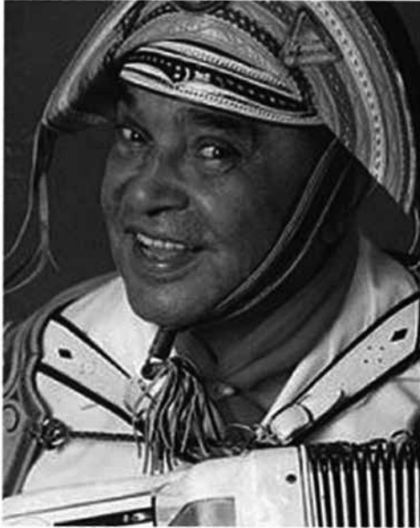
FIGURA 5. Luiz Gonzaga, creador del baião junto con Humberto Teixeira