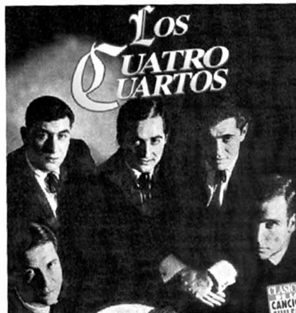
FIGURA 6. Los Cuatro Cuartos. Tapa del disco Clásicos de la canción chilena

Por entonces, se configuraba otro movimiento denominado Nueva Canción Chilena, que asumió una postura diferente a la de los neofolcloristas al negar su subordinación al mercado. De este modo, reafirmaban su valoración de la tradición sin abandonar la idea de renovación musical que recorrería otros caminos, caracterizándose por el compromiso político de sus compositores