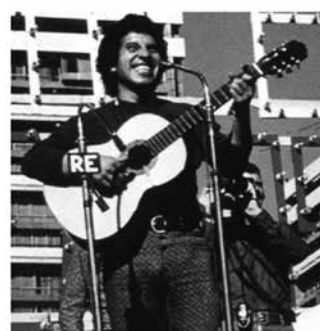
FIGURA 8. Víctor Jara. Foto y tapa del CD Pongo em tus manos abiertas (2001)