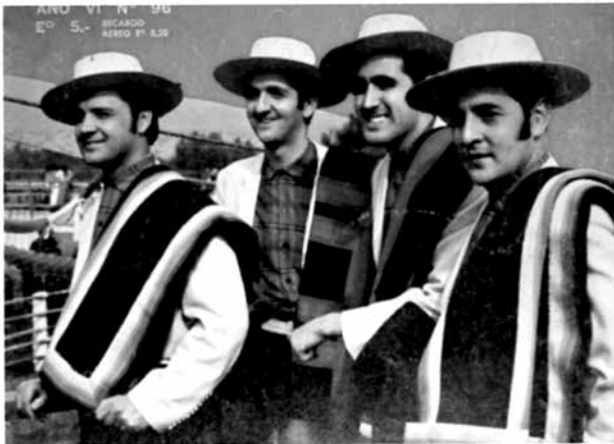
FIGURA 1. Conjunto Los huasos quincheros (1969). Revista El Musiquero , Año VI (96)

La tonada no es para bailar. Se destina a ser escuchada y usada como serenata (esquinazo). Su melodía es más romántica. Es un género lírico; se valoran las letras de las canciones. En este sentido, guarda un aspecto literario de registro, funciona como un espacio para la perpetuación y para la propagación de una cultura oral. Se interpreta con el arpa folclórica, instrumento utilizado en Paraguay,