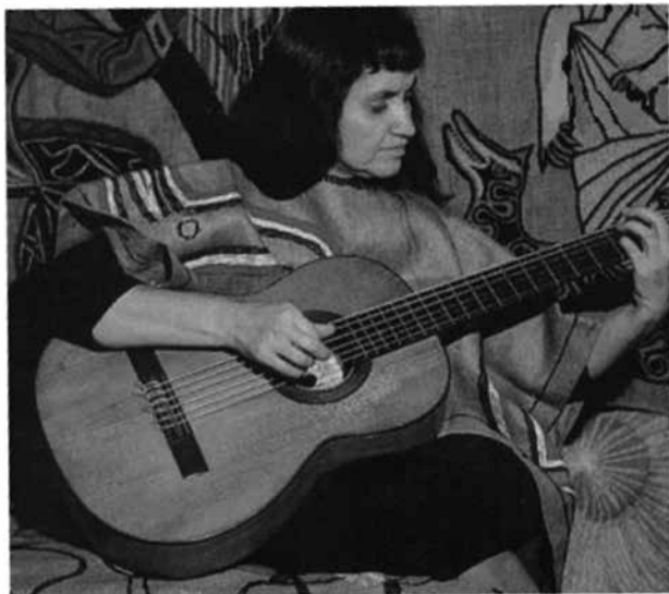
FIGURA 7. Tapa del disco Chants et Rythmes Du Chili (1991), Intérpretes: Violeta, Isabel y Ángel Parra, Los Calchakis

e intérpretes frente al rumbo que tomaba la historia de Chile a fines de los años sesenta.