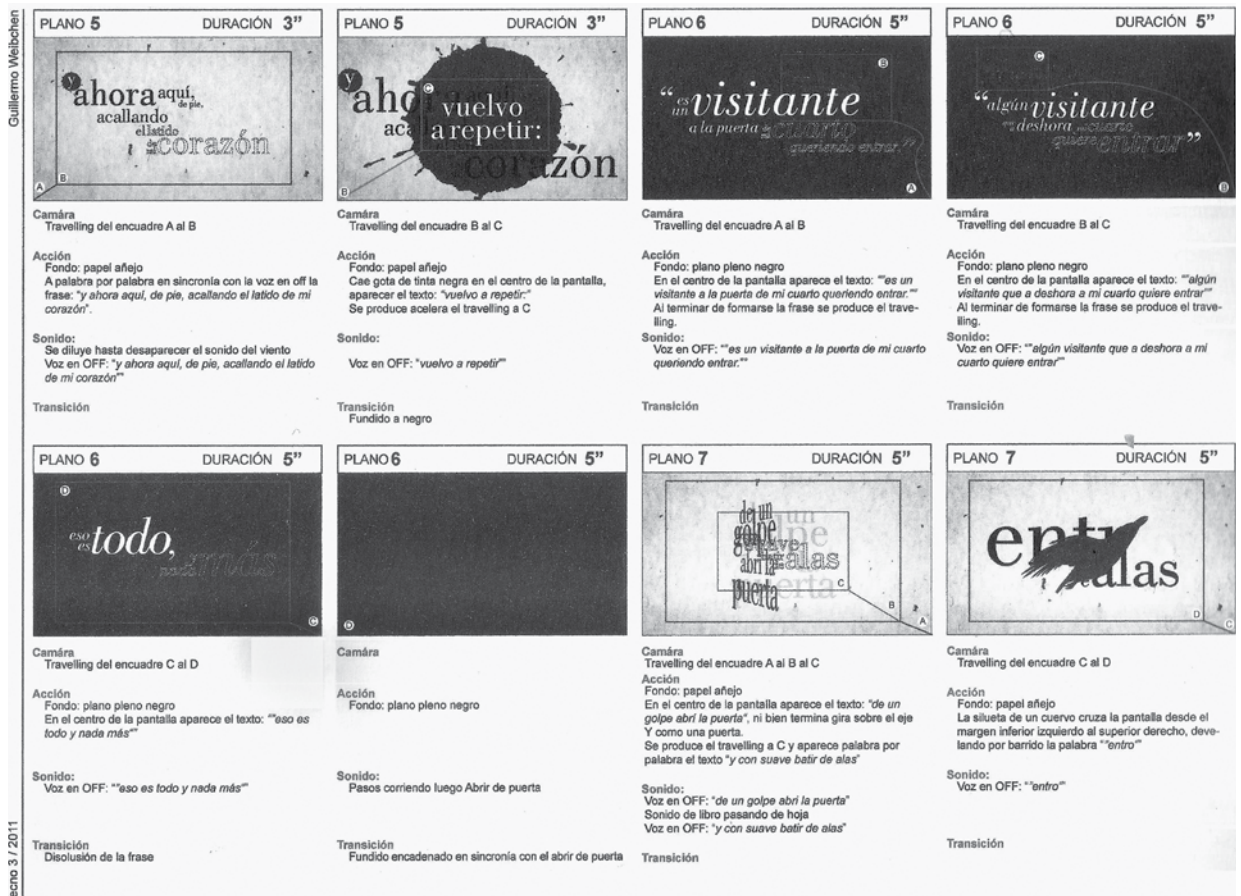
Figura 2. Técnicas del espacio sonoro con relación al par texto-imagen. Story board, codificación y análisis del lenguaje tecnológico. Investigación y proyecto de Guillermo Weibchen (2013)

La intención de consolidar un modelo empírico por parte de los estudiosos de la tecnología con relación a la sociedad queda, en general, supeditada al conocimiento –o no– sobre la experiencia de pensar y de producir el objeto. Convergen allí los múltiples factores que le dan sentido: se trata de entender lo que hace al proyecto. De modo que la investigación no solo consiste en reglas y en métodos basados en la literatura existente, sino, también, en una serie continua de observaciones, de descripciones, de manipulaciones, de pruebas y de respuestas de los que resulta una idea. Son apreciaciones que surgen de la experiencia sobre la materialidad; es un pensamiento que deriva de la producción visual y tangible. Para comprender en profundidad estas dimensiones hace falta la experiencia de proyecto, inclusive conocer la práctica vinculada al proceso mismo de producción hasta el objeto final, no ya como boceto acabado, anteproyecto o prototipo, sino como pieza final terminada y testeada [Figura 2].