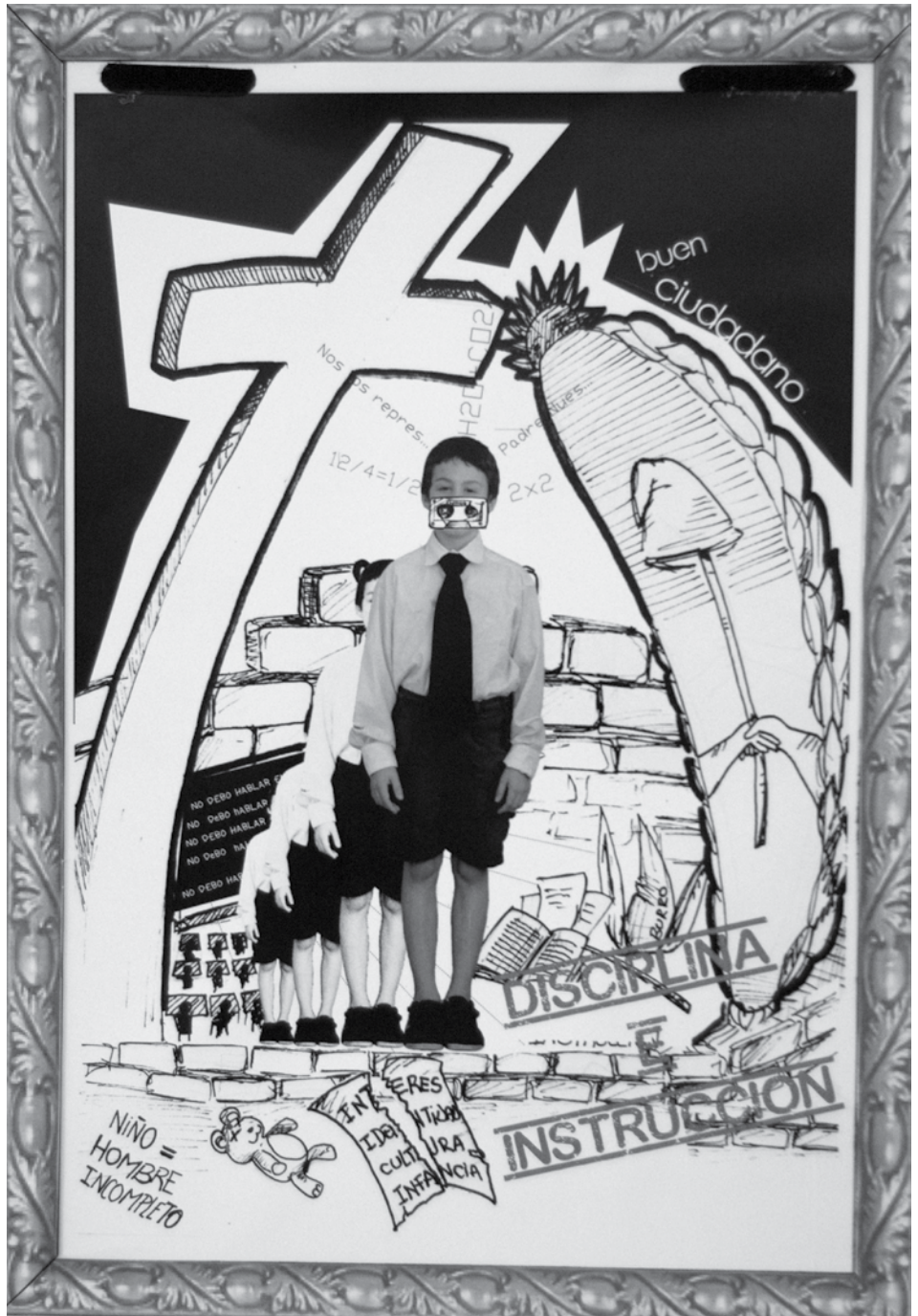
Figura 1. Foto registrada por Lorena Samponi, integrante del equipo