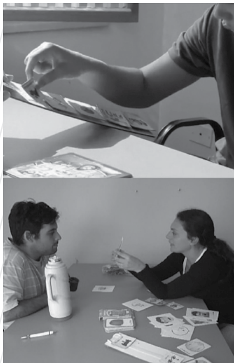
Figura 4. Testeos individuales de material didáctico realizados durante 2013 y 2014 en los consultorios de Apadea, en La Plata

Bárbara Ruiz, fonoaudióloga del mismo equipo, añade: «Hay un tema más profundo: en otros países se hablan otros idiomas, por ejemplo el inglés, y no todos tenemos acceso al idioma. Entonces el material importado se convierte en una barrera más que en una ayuda» (Ruiz en Amat, 2013b).