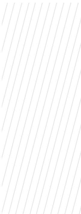
Figura 2. Prototipado de tarjetas de comunicación. Diferentes niveles de abstracción

texto deben ser adaptados y reversionados de manera experimental por los maestros y por los pedagogos de turno.