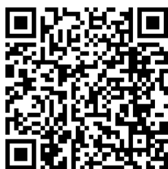
Figura 3. Código QR – ejemplo de Narrativas Digitales

La plataforma digital a utilizar será planteada por el docente en cada unidad, promoviendo un creciente desarrollo de competencias digitales.