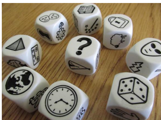
Figura 2. Rory's Story Cubes

Para lograr una mayor motivación de los alumnos, se utilizará la metodología del juego “Rory’s Story Cubes” que implica el uso de dados con imágenes que serán el punto de partida para la creación de las ND.