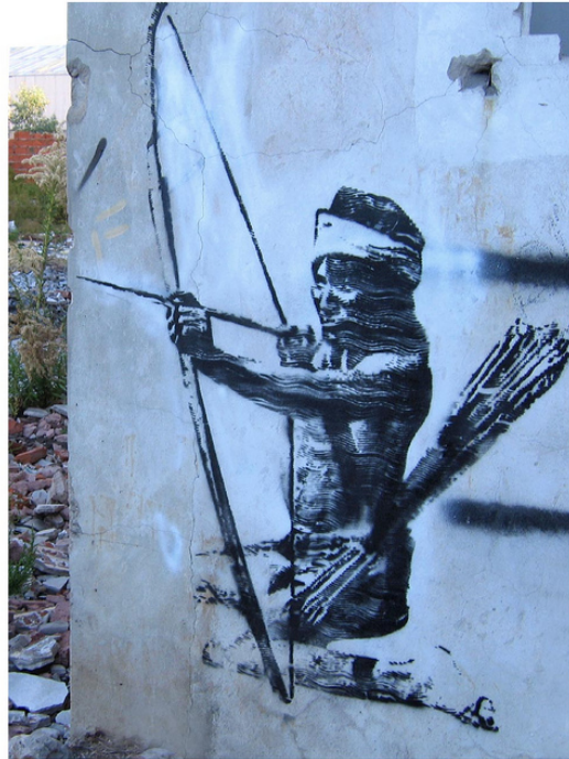
La Matanza, Bs As Argentina (América del sur) La Matanza Bs As-Argentina (South America)