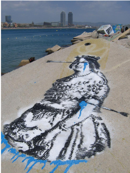
Barcelona, España (Europa) Barcelona, Spanish (Europe)