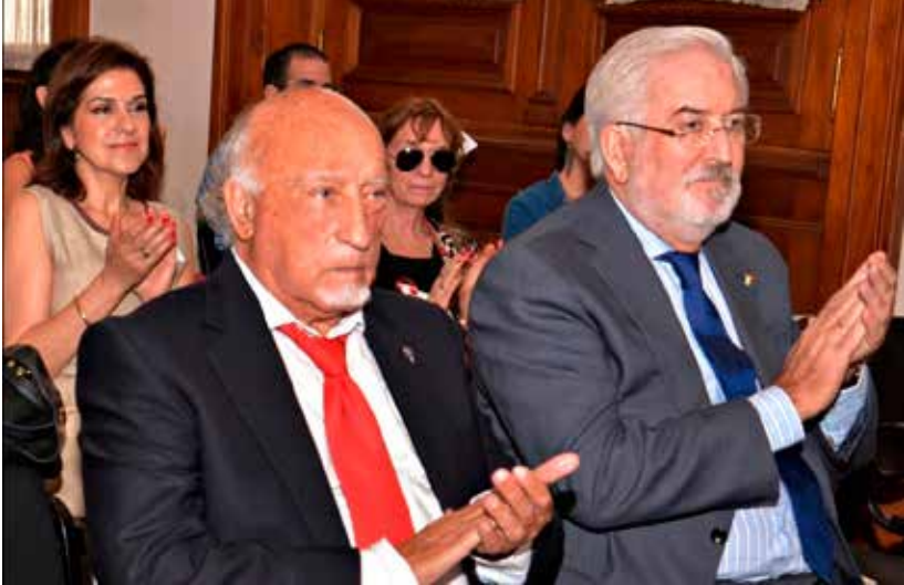
Manuel Vicent y el Embajador de España en Argentina, don Estanislao de Grandes Pascual