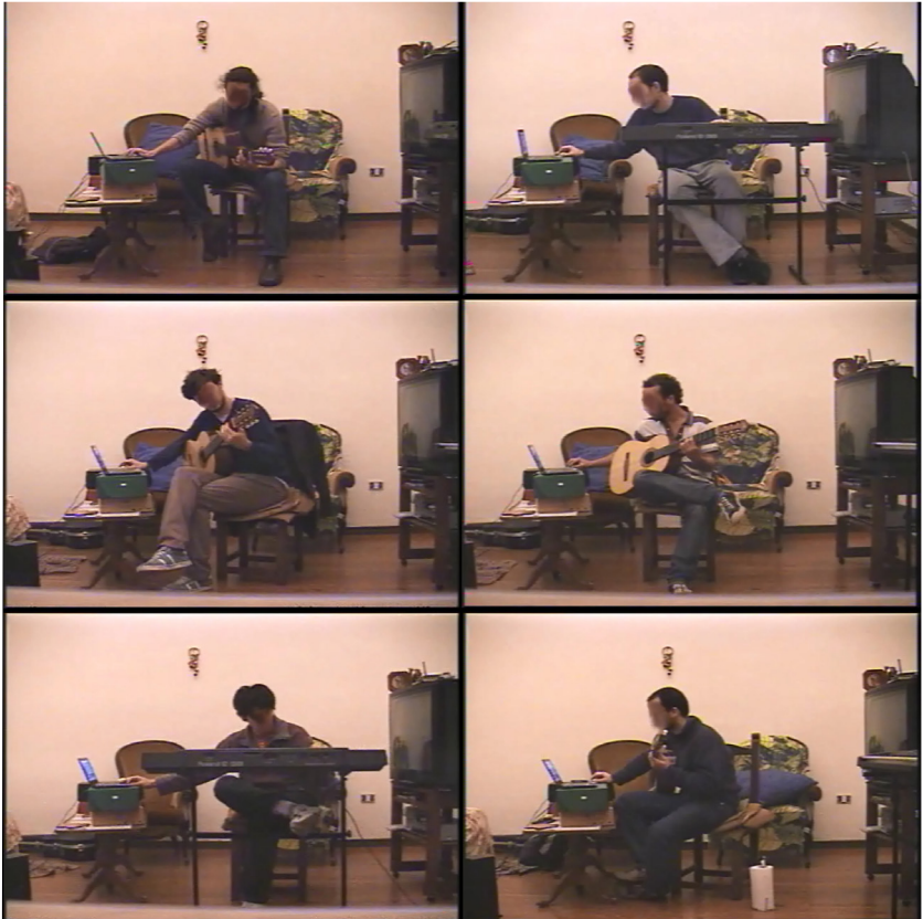
Figura 1. Capturas de pantalla que representan una “Postura extendida”.

grabación y el instrumento. Es el sujeto el que conecta a ambos y el que, a la vez, se modifica en sus decisiones, acciones y evaluaciones por lo que recibe de los demás componentes del sistema cognitivo extendido. En la figura 1 se pueden observar algunas capturas de video que dan cuenta de la citada “Postura Extendida”.